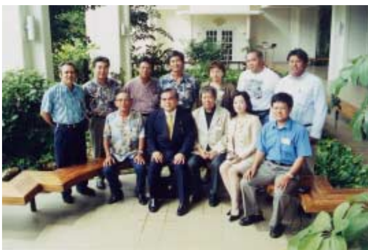
ヤシの実大学一行との記念撮影

さて、戦争当時の一九四五年に発生したマラリアはいわゆる戦争マラリアと言われていますが、実はちょうど一九四九年頃から計画移民や自由移民として沖縄本島や宮古島から八重山に移民団が入植してきたわけです。その時に、六千四十五名ほどのマラリア患者が新たに一九四九年から約七年間で発生しています。こ