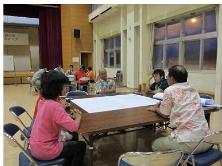
○チーム絆 (北西部地域)

グループワークでは、これまでの会議を通して検証された課題の解決方策について、引き続き検証が行われた後、その取り組み内容や実施主体など、より具体的な実践方法の検討が行われました。