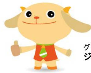
グッジョブ運動推進キャラクター ジョブたん