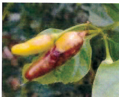
写真3 シマトウガラシの被害