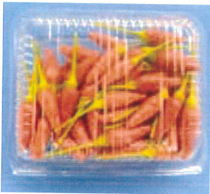
シマトウガラシ生果実