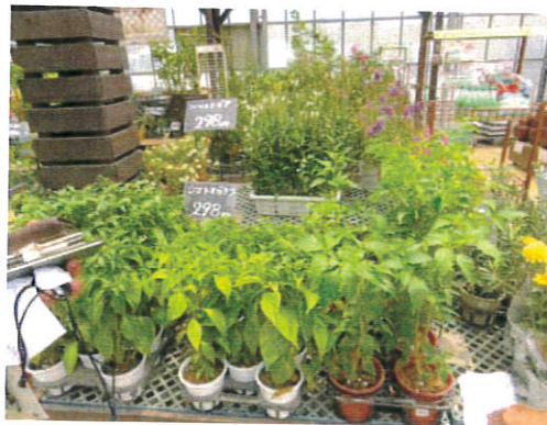
果実のついたシマトウガラシ苗