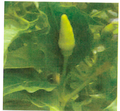
※未熟果も含まれます

沖縄県は、辛味トウガラシ類生果実の 移動自粛を行っています。 ご理解とご協力をお願いします。