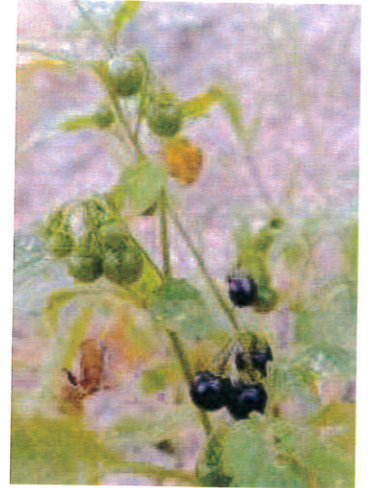
テリミノイヌホオズキ