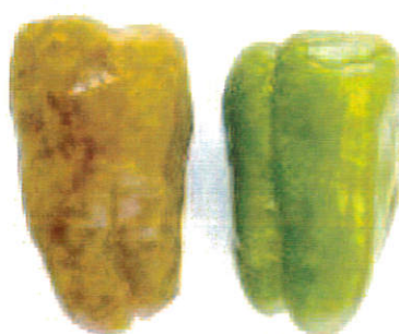
写真4 ピーマンの被害(左)