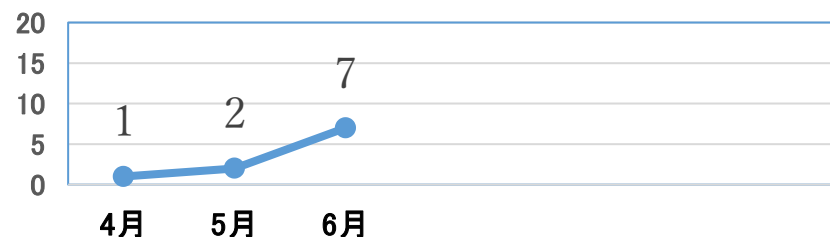
海洋危険生物別の被害状況