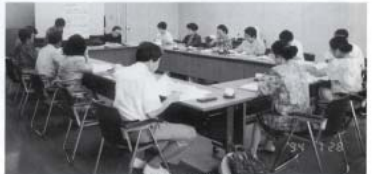
石垣市女性問題会議