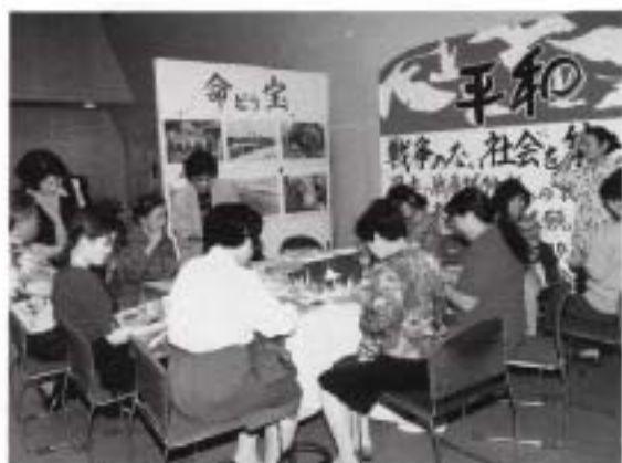
命の宝、戦争のない社会を築こう (全電通八重山分会 NTT八重山女性委員会)