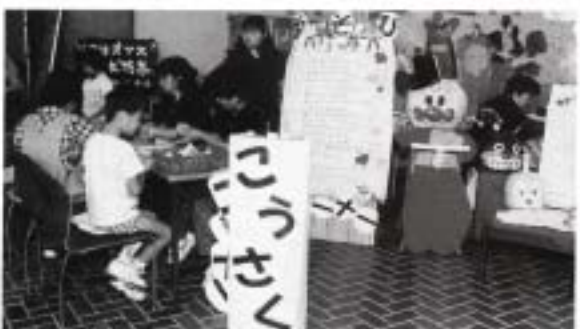
八重山に伝わる伝承遊びを子ども達に伝えよう (児童文化サークルいちご会)