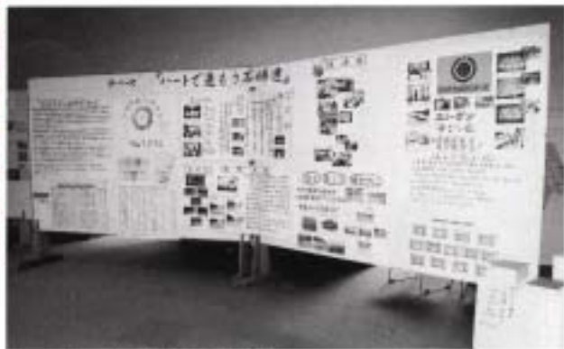
ハートで進もう石綿連 (石垣市婦人連合会)