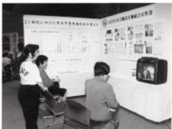
21世紀に向けた男女平等参画社会を考える (自治労石垣市職員労働組合女性部)