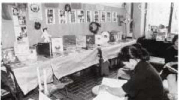
母親と子どもがゆとりを持ち、豊かな心を読書の楽しみで育てよう (石垣市文庫連絡協議会)