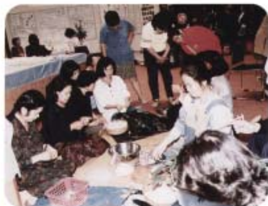
～かゆき 響き合う やいまの 女たち～ 「まるざーフェスティバル」