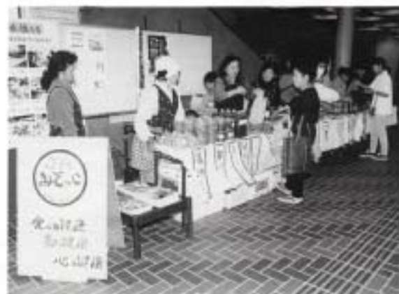
地元の素材で健康食 (JA八重山郡女性部)