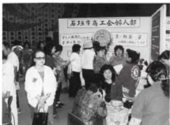
資源の節約、地球にやさしいライフスタイルの工夫 (石垣市商工会婦人部)