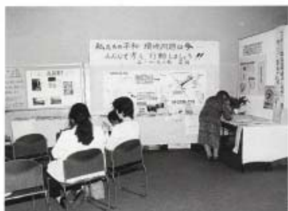
平和・環境問題は今、みんなで考え行動しよう！ (みどっんの会石垣)