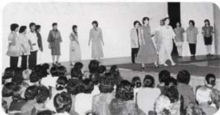
八重山の風土に合った 衣服を考える (石垣市織物事業共同組合)