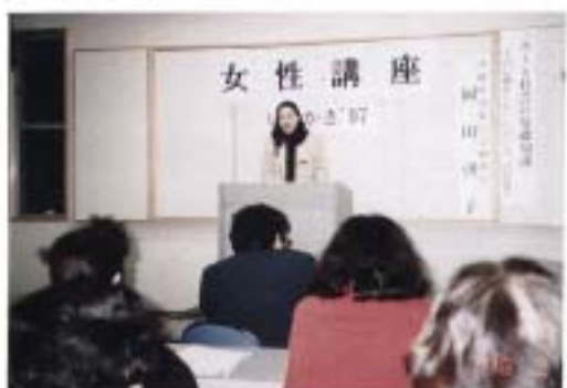
「カード社会の基礎知識」 (県消費生活センター八重山分室)