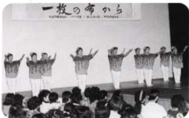
オープニングセレモニー 楽しく踊って女性活動の活性化を(石垣市民踊愛好会)