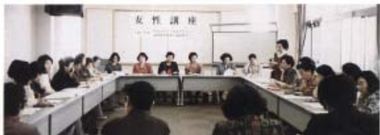
「中国・四国・九州地区男女共同参画推進地域会議報告会」