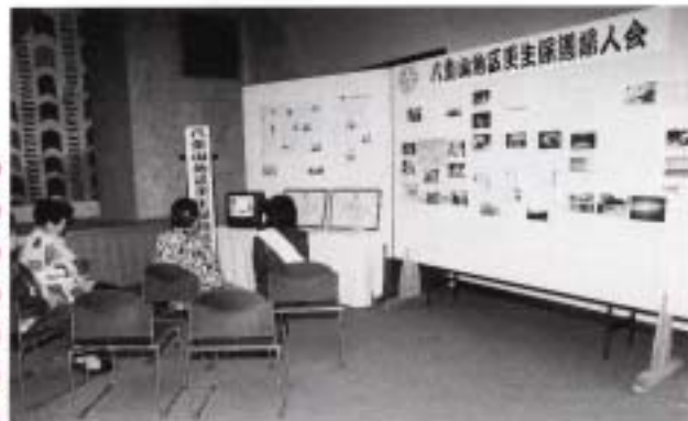
八重山更生保護婦人会の活動紹介 (八重山更生保護婦人会)