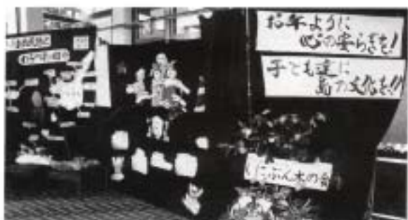
子ども達に心の豊かさや島の文化を (児童文化サークルくにぶん木の会)