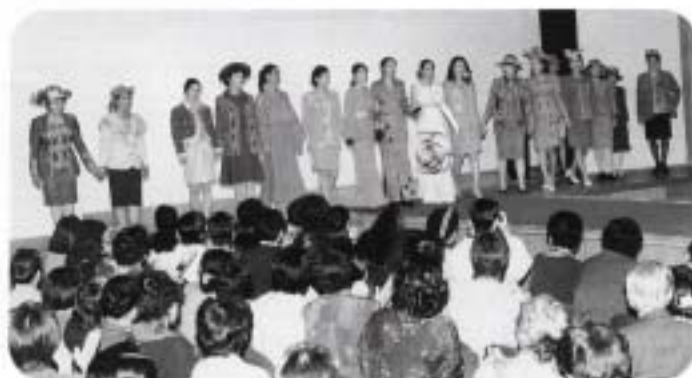
亜熱帯の布を着る (いつよ会)