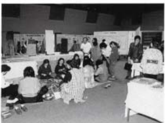
布と八重山の糸づくり (石垣市・竹富町織物事業共同組合) 3)