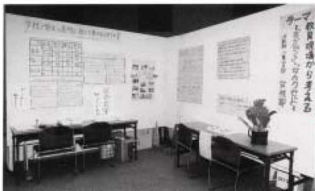
教育現場から考える「男だから」～「女のくせに」 (沖教組八重山支部女性部)