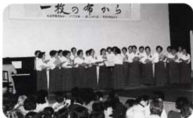
オープニングセレモニー 歌声でリフレッシュ(コーラスあかようら)