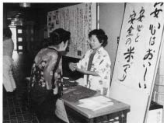
安心と安全の米づくり (うよん田の会)