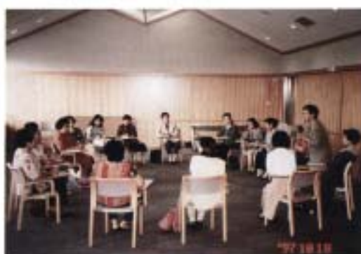
「あなたと私、対等なパートナー」 (ビデオ学習と話し合い)