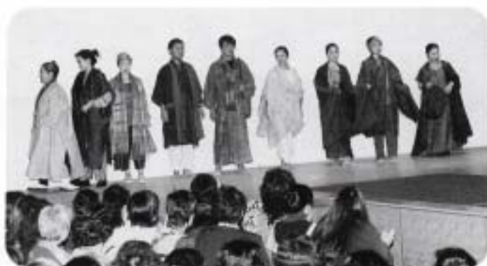
一枚の布から (竹富町織物組合)