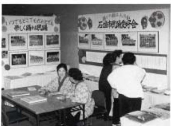
楽しく踊って女性活動の活性化を図る (石垣市民踊愛好会)