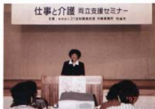
「仕事と介護」 21世紀職業財団沖縄事務所