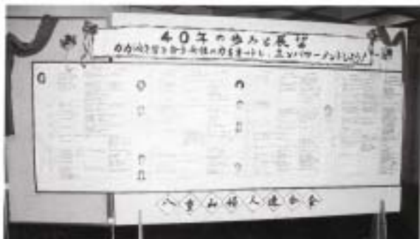
40周年を迎えた八重山婦人連合会の歴史の足あと (八重山婦人連合会)