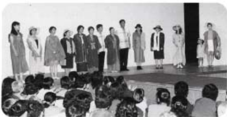
八重山の手織り (繰ぐるまの会)