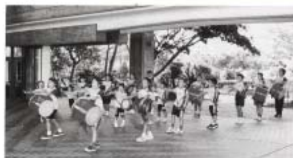
オープニングセレモニー(子どもエイサー隊)

ワークショップ、ファッションショーといづれも女たちのエネルギーな取り組みが大きく稔り、好評のうちにまるざーフェスティバルを終了した。