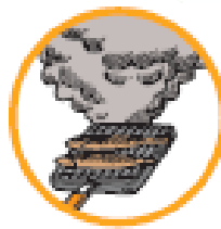
調理時の煙や湯気