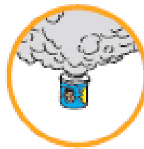
くん煙式殺虫剤など