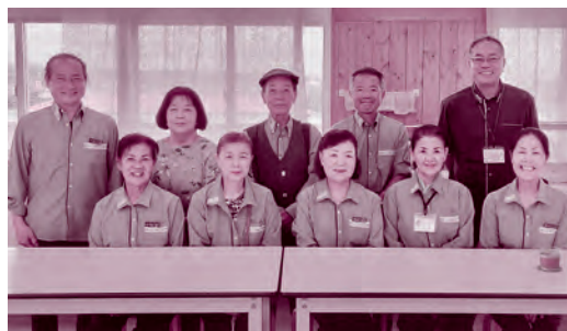
登野城小学校への学校訪問