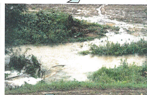
降雨時の流出状況