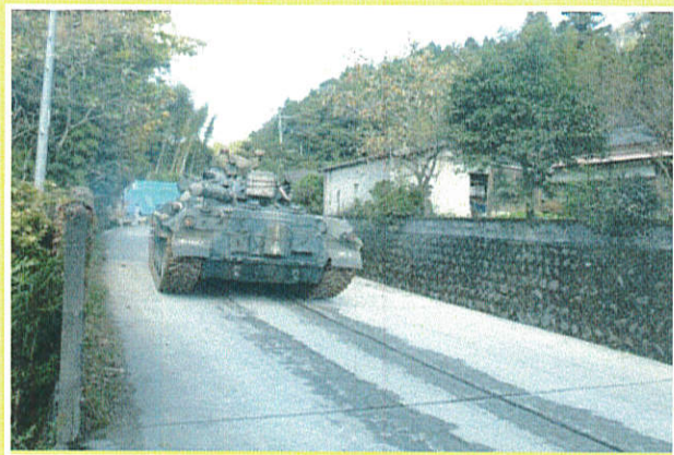
路面損傷 →舗装補修