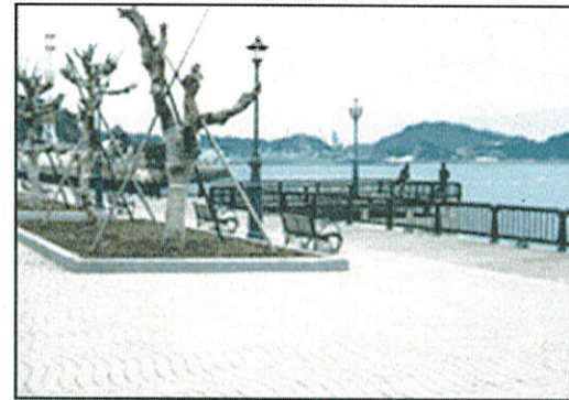
公園【避難場所、防災拠点】

有線ラジオ放送施設、無線放送施設、消防施設、救難施設、公園、緑地、屋外運動場、体育館、コミュニティ供用施設、水道、し尿処理施設、漁業用施設