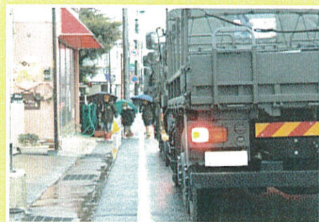
歩行者への危険 →歩道整備