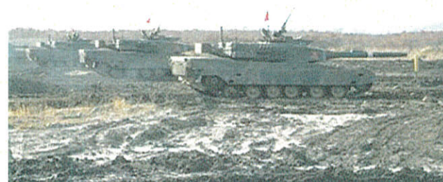
訓練に伴い 演習場が荒廃