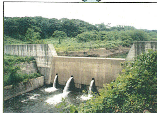
土砂流出対策の実施