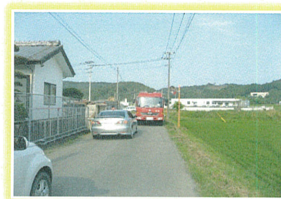
消防活動への支障 →車道拡幅