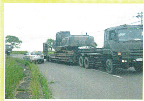
離合困難 →車道拡幅