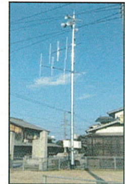
無線【避難・消防活動の円滑化】