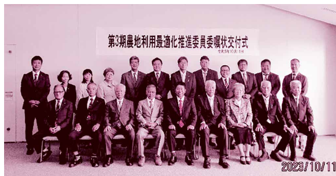
第3期農地利用最適化推進委員