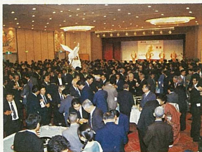
新年を寿ぎ交流を深めた新春名刺交換会

市主催の恒例の新春名刺交換会が、一月四日午後四時からホテル日航八重山で約八百人が参加し、盛大に開かれました。祝賀会には商工会婦人部の音頭で参加者全員による市歌斉唱が始まりました。