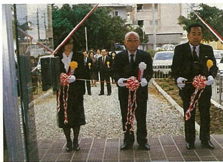
内原市長らによるテープカット

開園式には通園している子どもや母親、保母をはじめ、多くの関係者が出席し、開園を祝いました。