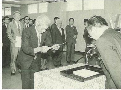
市では、次の通り人事異動が行われました。