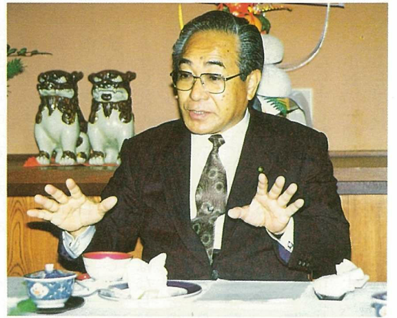
▲「若者の意見を行政に」と半嶺市長