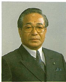
市長 泰 當 嶺 半