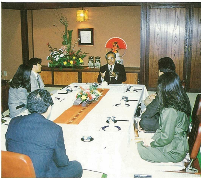
▲和やかな雰囲気でもちづくりについて語る「新成人と市長の新春座談会」

若者が今、何を求めているか。何を望んでいるか。まちづくりをどのように考えているか……。ということで、今年、新成人を迎える5名の方をお招きし「新成人と市長の新春座談会」を1月5日に開催しました。以下、内容を掲載します。