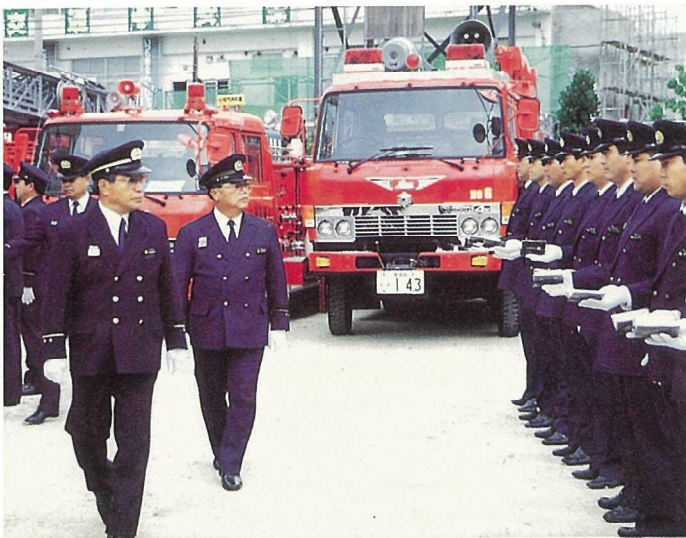
▲半嶺市長による特別点検