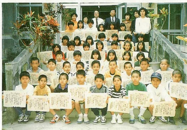
▲「子ども博物館」終了生記念撮影

石垣市立八重山博物館は本土復帰記念事業の一環として昭和四十七年十月に開館しました。以来十八年間「地域に根ざし、地域に学び、地域へ奉仕する」ことを目標に運営してきました。