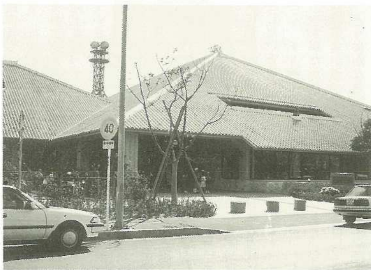
▲情報収集の場・学習の場として大いに活用されている市立図書館

これまでに図書館に寄せられた声には「五冊まで本を借りることができるので助かる」「調べたいことがすぐに調べ