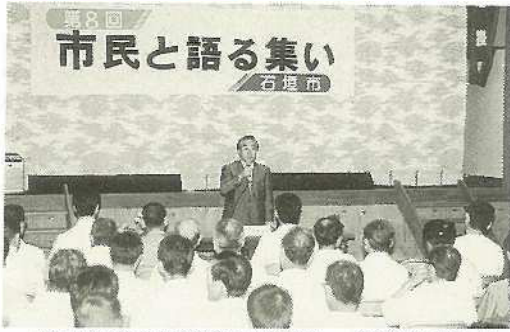
▲約50名余の地域住民が参加し、活発な意見や要望が出された第8回「市民と語る集い」