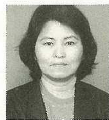
当銘秀 新栄町 2-5223