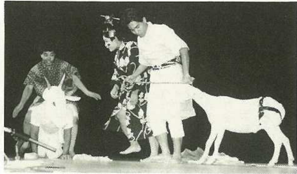
▲登野城青年会のキョンギン「ピビジャー」