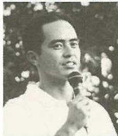
南風野石青協会长

をもったことがないんです。そこで、市長に要望なんです。がお互い青年同士が交流できる機会を作っていたらいいと思います。 市長 皆さんの活動は大変、すばらしいと思います。今、話のあった親善都市、友好都市との青年同士の交流会はともないうのは、これまでは行政や各団体のトップレベルでしか交流が行われなかったわけですからね。市民レベルでの交流がなければ真の意味での友好関係はできません。ぜひ、実現できるように努力します。