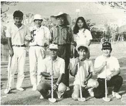
▲半嶺市長を囲んで和気あいやいとグラウンドゴルフを楽しむ