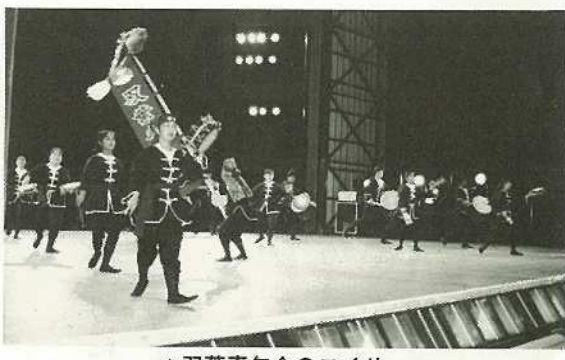
▲双葉青年会のエイサー