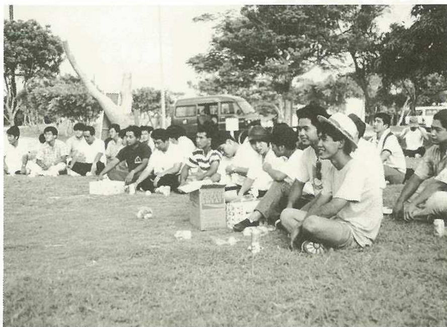
▲青年約200名が参加し、市長とひざを交えて明日の石垣市を語る (市中央運動公園)