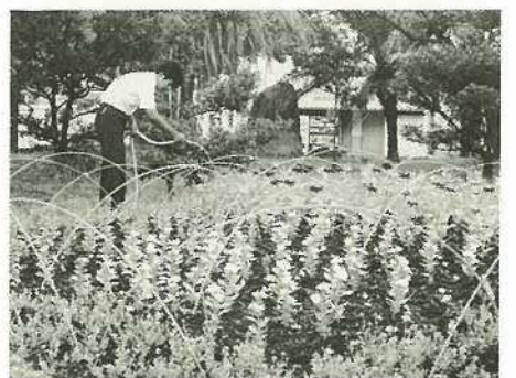
▲市役所通り花いっぱい運動のメイン花壇 (市役所北側広場)