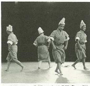
▲ゆらていく組による「黒島口説」

土曜閉庁制度は、わが国がヨーロッパ、アメリカ諸国に比べ労働時間が長いことを考慮し、先進国にふさわしいゆとりある生活を実施するために導入されたものです。このような社会情勢を踏まえ、石垣市においても今回、土曜閉庁制度を導入することになりましたので、市民のご理解とご協力をお願いします。なお、土曜閉庁が実施される部所もあり業務が行われる部所もありますので、一覽表をよくお確かめください。