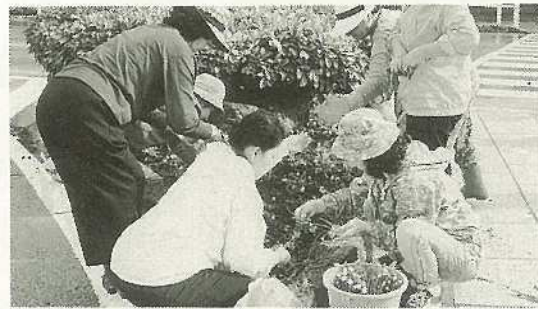
▲「どうかきれいに咲いてください」と願いを込めて花植えに汗を流す

で埋め尽くし、道行く人やドライバー、観光客の皆さんの目を楽しませよう——というものです。その手始めとして八月十八日に石婦連約二百名により、市役所通りの花いっぱい運動が展開されました。 今回はその第二回目にあたり、この日、石婦連の役員を中心に約五〇名の婦人が参加し同交差点の植栽枠にひまわり、百日草、日々草、マリゴールド、マツバボタン等を植え汗を流しました。この花の苗はすべて寄贈によるもの