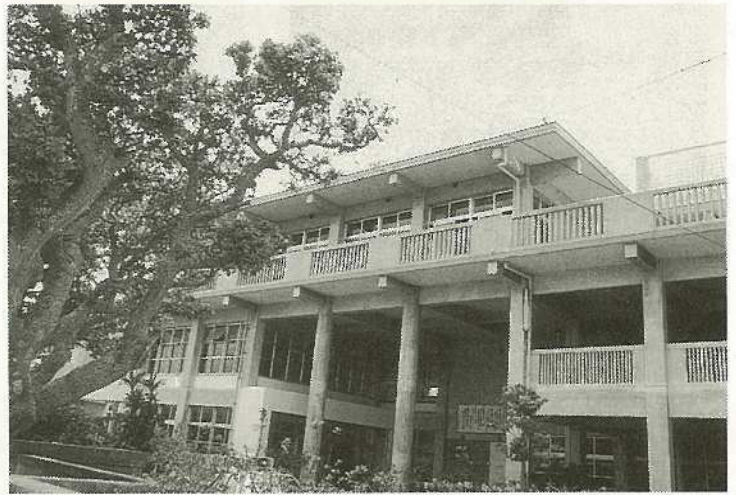
▲郵便貯金の融資を受けて建設された石小校舎

郵便貯金は、住み良い社会づくりに役立つように使われています。 郵便局の郵便貯金は、明治八年の創業以来、身近な貯蓄として広く国民のみなさんに利用いただいています。これまでに預けられた貯蓄の総額は全国で約一三六兆円、県内においても約五、一六八億円を超えています。（平成三年三月末現在） みなさんからお預かりした大切なこのお金が、どのように使われているかご存知でし