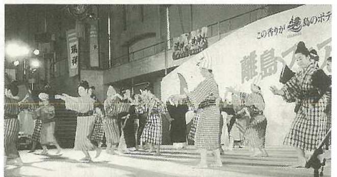
▲地元・石垣が六調節でファイナーレを飾った