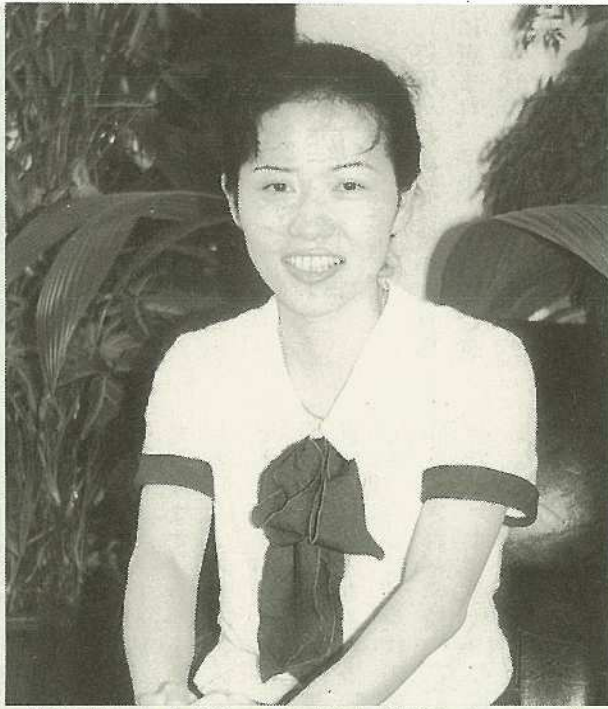
「夢は常に大きくもって自分の可能性にチャレンジしたい」と話す初美さん