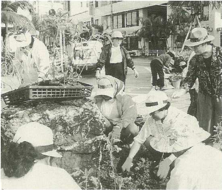
「私たちのまちは私たちの手できれいに」をモットーに市役所通り花いっぱい運動に続いて730交差点にも花植えをする石婦連の皆さん