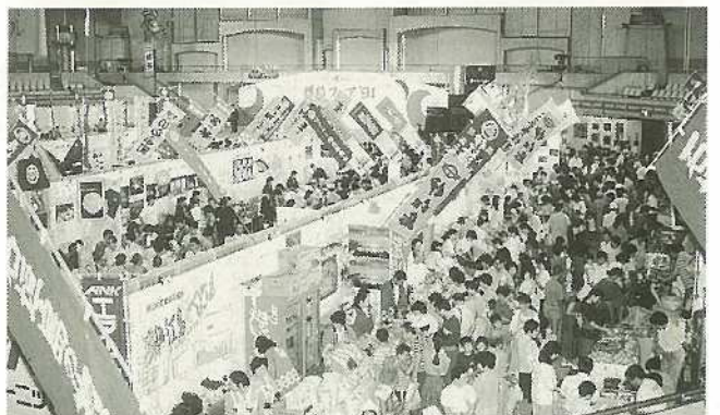
▲会場には約10万人の人々が集まった