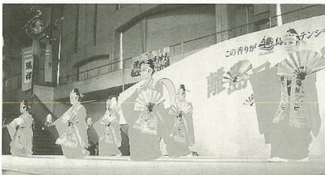
▲観客に感銘を与えた八重山民俗舞踊保存会による「美ら島八重山」

「この香りが島のポテンシャル」をテーマに離島フェア'91が九月二十一日から二十三日までの三日間、宜野湾市の沖縄コンベンションセンターで開かれ、大盛況でした。離島フェアは今年で第三回目を迎え、その開催目的は島の地域特性を広く内外に紹介し、そして島に誇りを持ち、産業振興と伝統芸能の継承者育成を行い、活力と魅力に満ちた地域づくりを一層推進しよう——というものです。会場は県内離島二十四市町村の特産品が一同に陳列され、買い物客や観光客で大いに賑わい、三日間にわたって約十万人が入場しました。一方、ステージでは各島自慢のアトラクションが繰り広げられ、地元・石垣からは八重山民族舞踊保存会が「美ら島八重山」を披露し、ファイナーレを飾り、会場を沸かせました。以下、出店業者を紹介します。