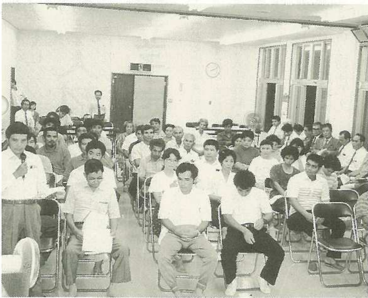
▲「生活環境整備問題」をはじめ地域活性化について熱烈な意見が交わされた

市政②全島の均衡ある発展③女性登用④行政の合理化の四つの柱を掲げ、市政を遂行しています。市民と語る集いは開かれた市政の一環として行っているもので、これには二つの大きな目的があります。一つは市民の日常周辺の問題を吸い上げ、それを行政に反映させていくということです。もう一つの目的は、市民皆さんが自分の意志で市政を動かしているんだという実感をもってほしいということです。