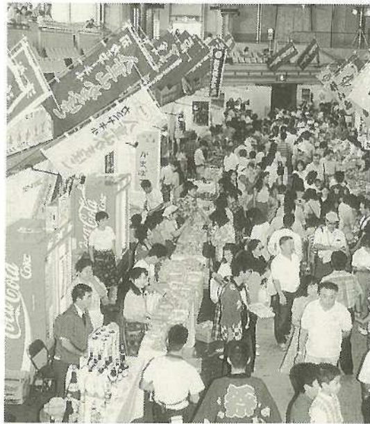
▲地元から9業者が出店し、お客さんの人気を集めた