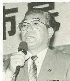
市長 嶺 半