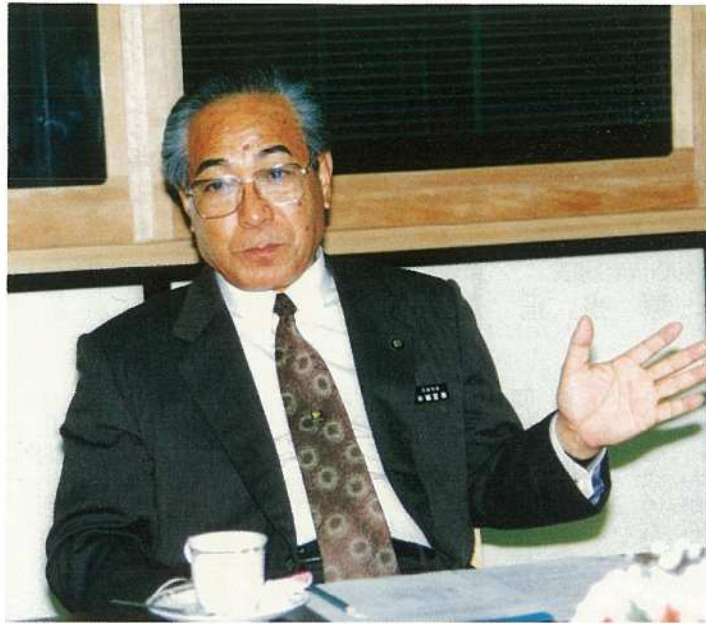
今年ゴミ問題、リサイクル運動等の環境問題に重点的に取り組み、ゴミ市長に徹したいと話す半嶺市長