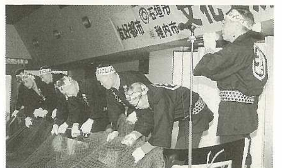
▲漁業のまちをおもわせる稚内の勇ましい「にしん沖揚音頭」