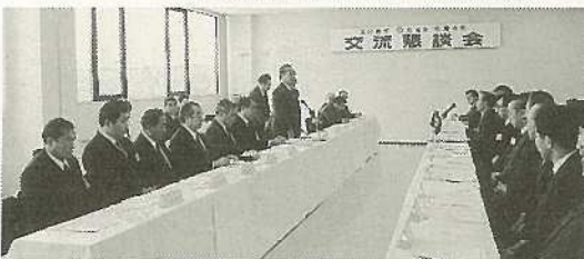
▲両市の代表による交流懇談会