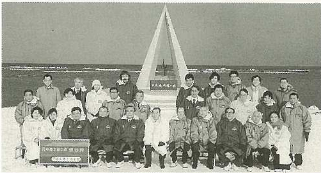
▲日本最北端の碑で記念撮影