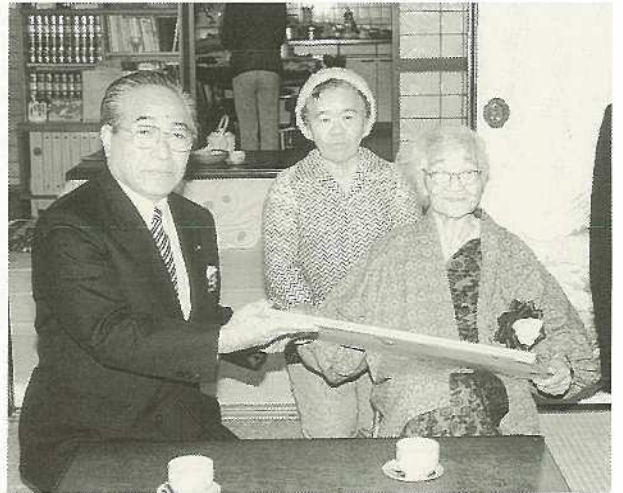
旧正の2月4日に半嶺市長をはじめ市の3役、部課長が今年85歳と100歳を迎えられる方々を訪ね長寿を祝い、頌状と記念品を贈りました。