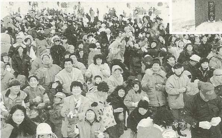
▲稚内のメイン行事である「氷雪の広場」・冬まつりには多くの市民が参加し、賑いを見せた