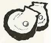
市貝・クロチョウガイ