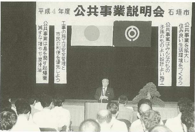
△建設関係業者が参加して行われた公共工事説明会

一四―四・三一五―二十五・三一五―二十街路改良工事、新港地区物揚場(一四、〇m)工事、港湾施設用地(護岸)工事、臨港道路工事、上屋建築工事、船越漁港航路浚渫工事、登野城漁港環境整備工事、登野城漁港道路工事、増養殖機能施設整備、森林活用環境整備建設工事、東屋及び便所区草地造成、サンライズパーク整備工事、児童公園施設整