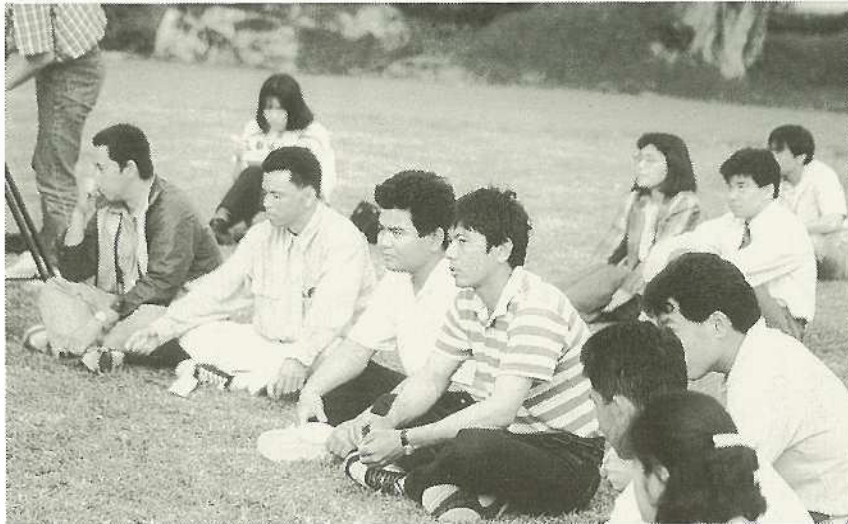
司会 これより「農業青年と語る集い」を開催いたします。

石垣市の将来の農業を共に考えよう——というところで、第十四回市民と語る集い「農業青年と語る集い」が四月十六日午後六時から於茂登のジューマルで開かれました。会場には農業青年、農業関係者が約四十名参加し、今後の石垣市の農業、畜産業のあり方、後継者育成の問題、農村集落環境整備の問題、流通システムの問題等々の意見が続出し、有意義な話し合いがもたれました。その中で半嶺