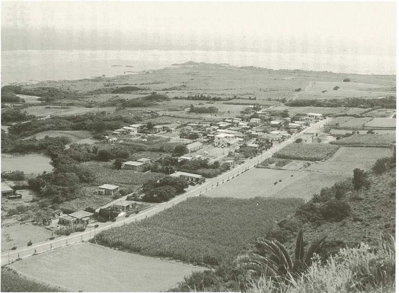
山当山西頂から平野集落をのぞむ

編集・発行／沖縄県石垣市総務部企画室 石垣市美崎町14番地 ☎(09808)2-9911