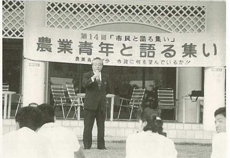
▲(%)第14回市民と語る集い