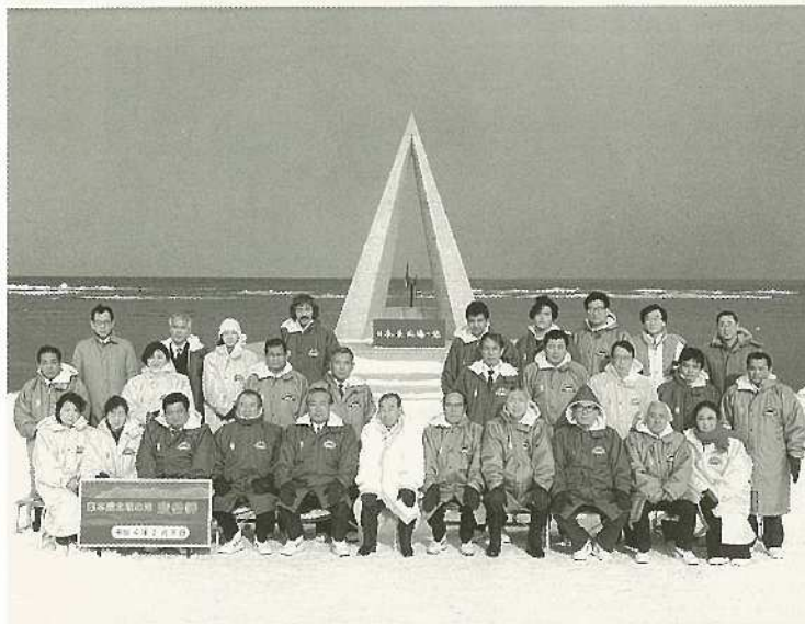
▲(%) 友好都市訪問団が稚内市を訪問