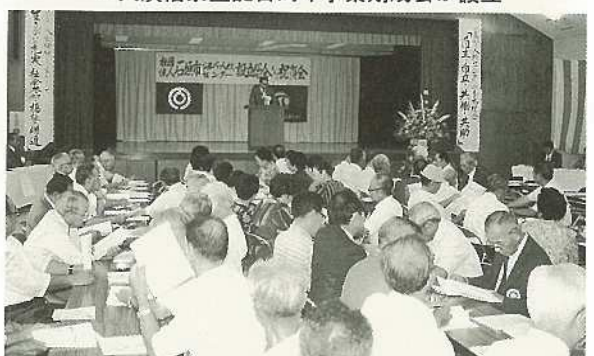
▲シルバー人材センター開所