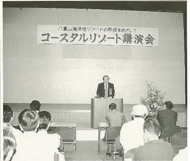
▲(%)コースタルリゾート講演会