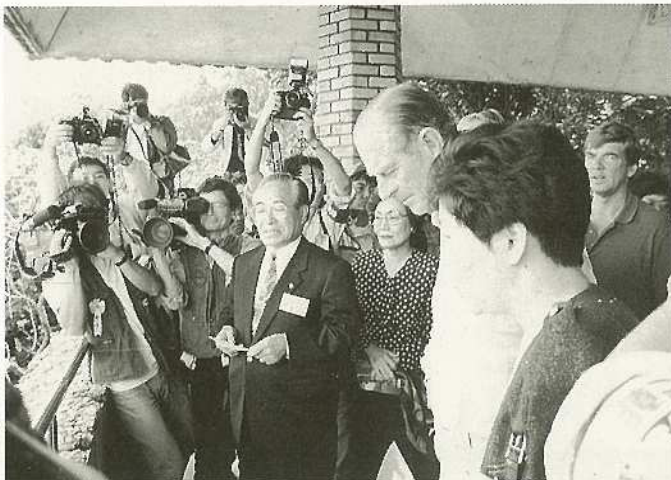
▲(%) 英国エジンバラ公来市