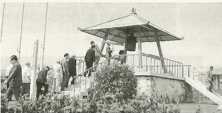
▶(%)子育て平和の日祈念鐘打式