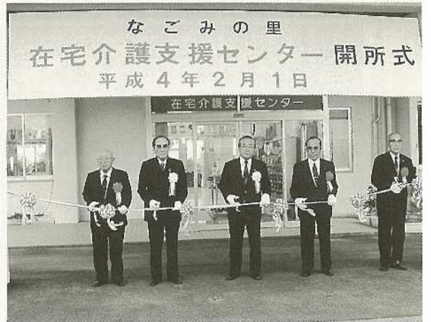
▲(%) 在宅介護支援センター開所