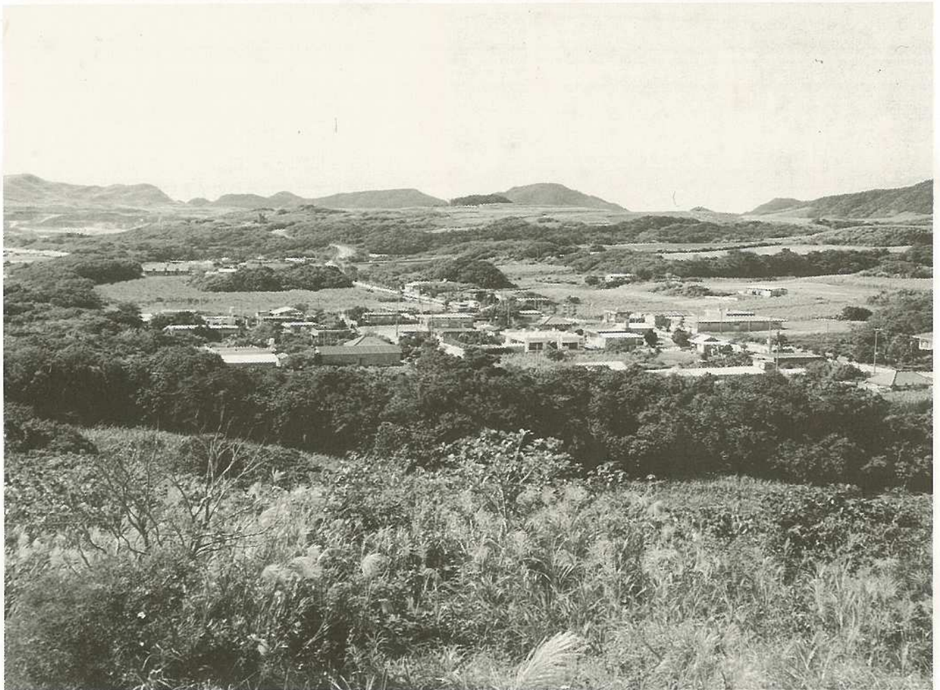
野原岳から星野の集落をのぞむ

編集・発行／沖縄県石垣市総務部企画室 石垣市美崎町14番地 ☎(09808)2-9911