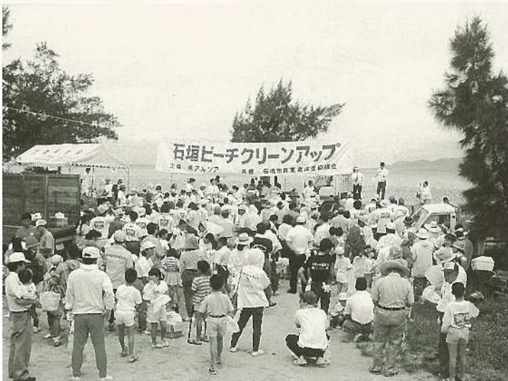
▲(%)名蔵湾クリーン作戦を展開