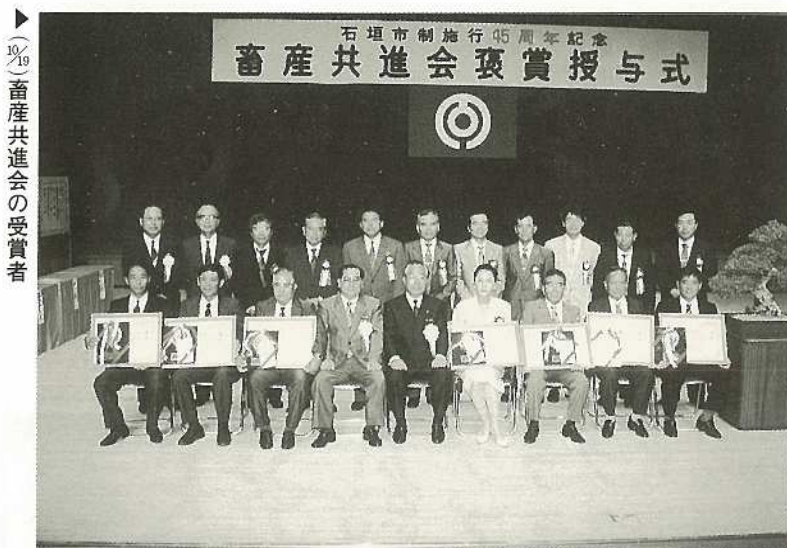
▶(%)畜産共進会の受賞者