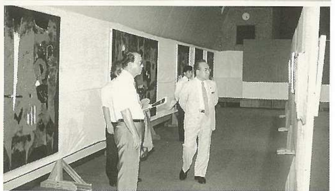
7/16 半嶺市長絵画展を観賞