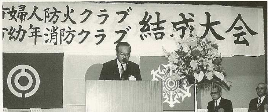
▲婦人防火・幼年消防クラブ結成