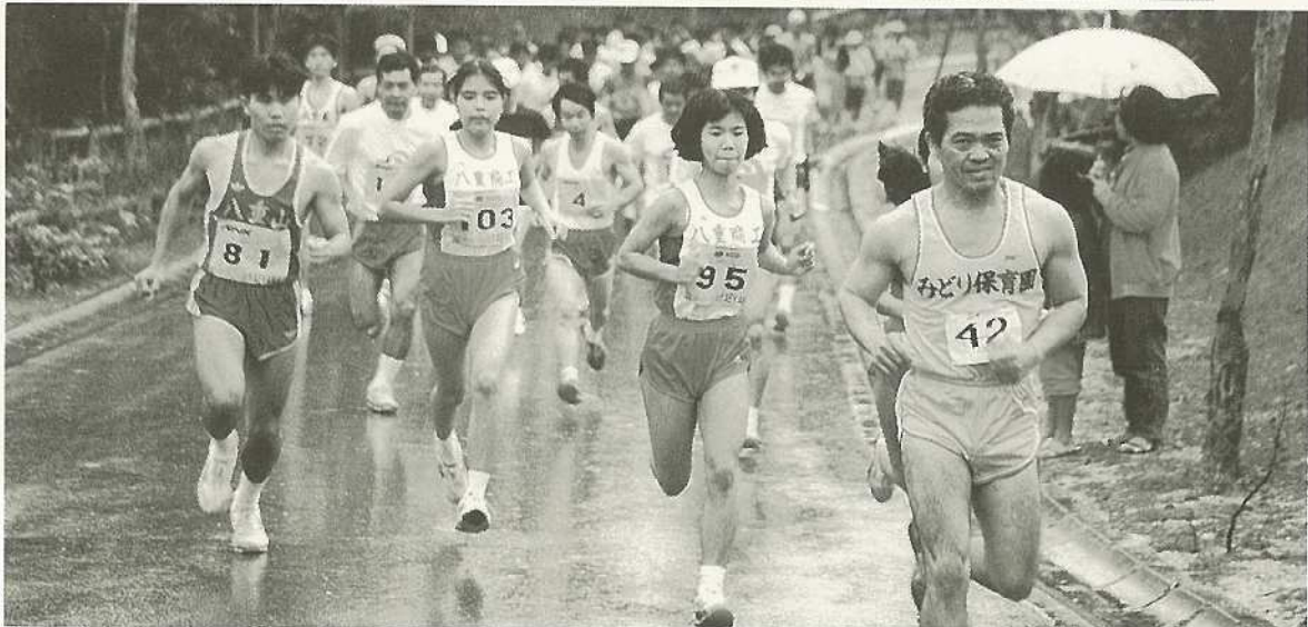
クロスカントリー大会