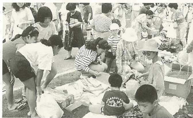
7/6 リサイクル青空自由市