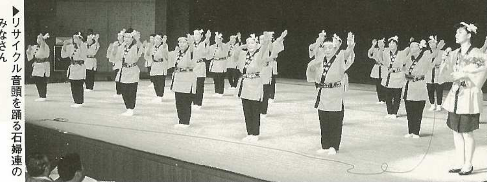
▶リサイクル音頭を踊る石婦連のみなさん