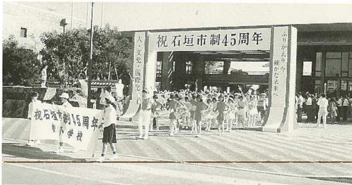
▲市制45周年記念式典