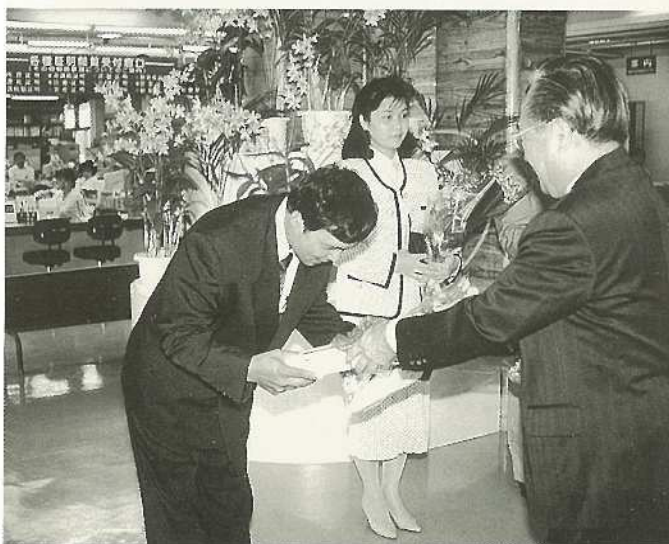
▲(%)結婚の祝事業の第一号