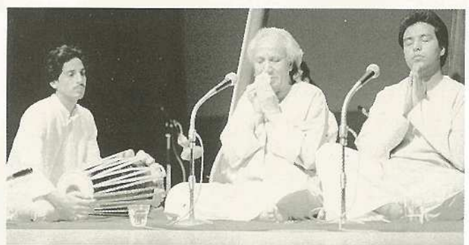
7/28 インド舞踊団公演