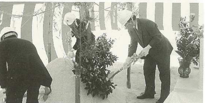
▲川平浄化センター起工