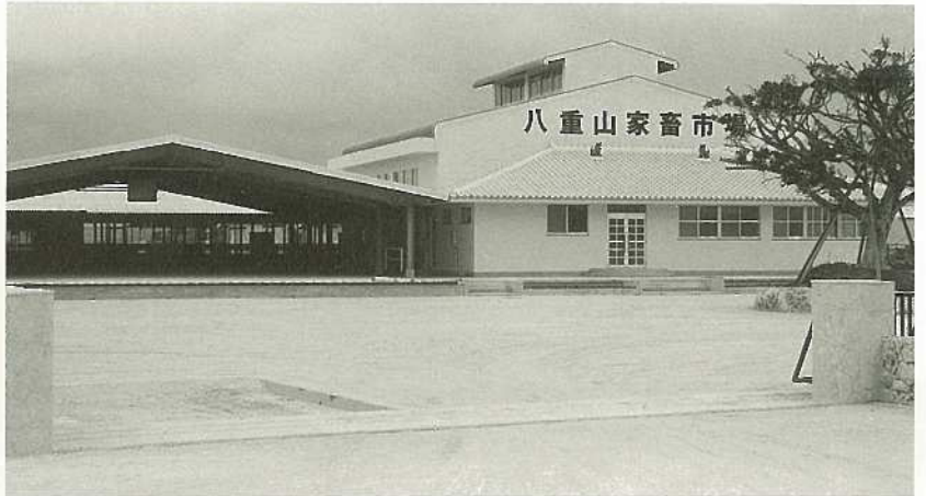
△八重山家畜市場全景

新しい八重山家畜市場の竣工式が、一月十九日真栄里上原の八重山家畜市場構内で行われました。昭和四十九年に磯辺に設立されたセリ市場は、敷地が狭く、施設も老朽化が著しく、その上、最近の肉用牛頭数の急激な増加に対応することができないことから、国、県と調整し、平成二年度の農用地整備公団事業推進協議会で、八重山第二区域で実施することになり、平成三年度から工事が着手され、このほど竣工しました。施設は総事業費三億四千万で、敷地が約二haの面積に、けい留所（四〇〇頭）けい宿所（子牛二九〇頭）、堆肥舎、乾草庫、事務所、売場棟を建設、セリ業務を正確、迅速かつ効率的に行うためコンピューターを導入。自動セリ機、自動牛衝機等をオン