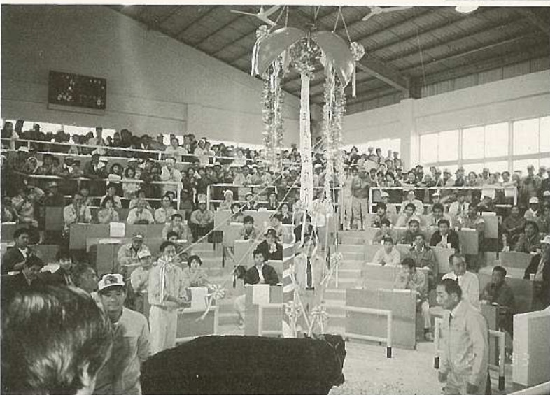
△畜産農家多数が参加した初セリ