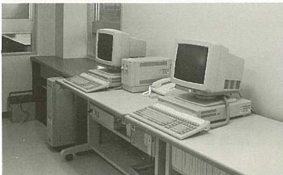
△電 算 室