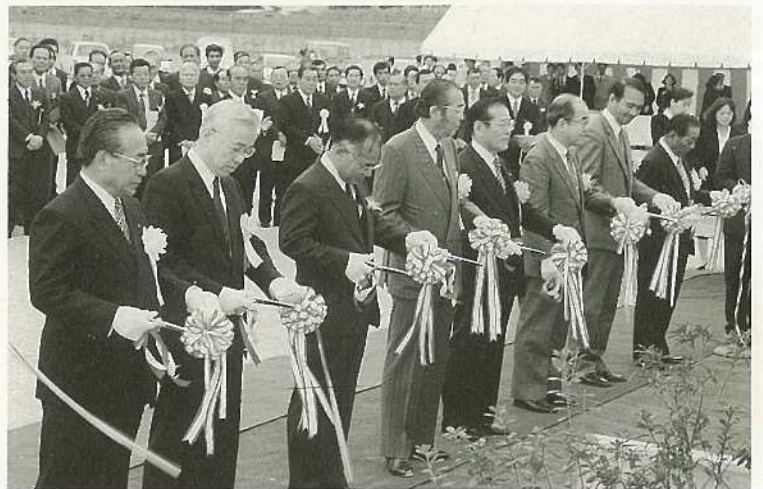
△テープカットを行う関係者