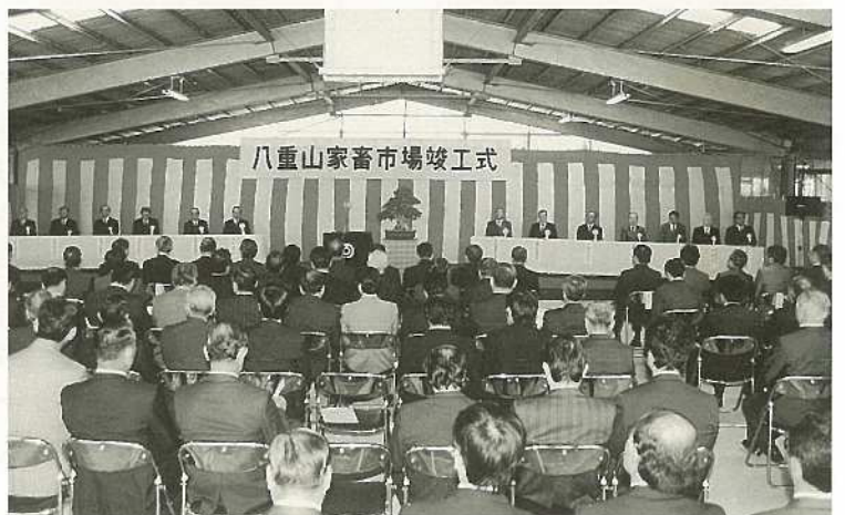
△盛大に竣工式典が催された