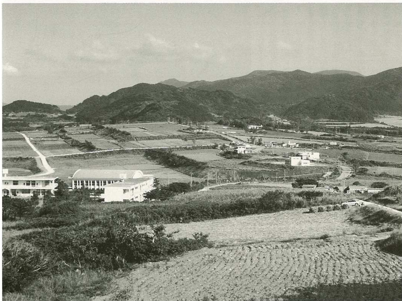
屋良部岳から崎枝の集落をのぞむ