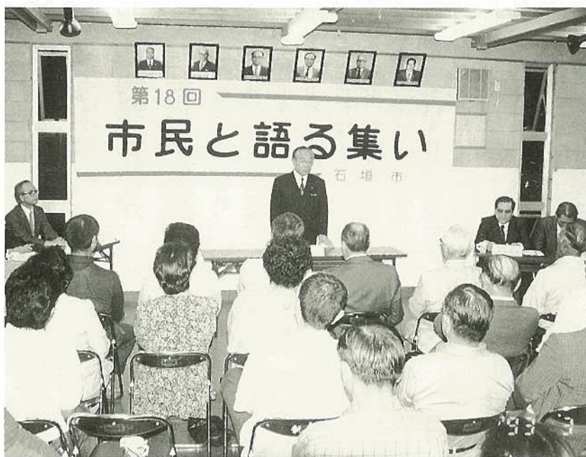
▲生活環境問題で熱心に意見交換。

第19回「市民と語る集い」が、新栄町地区を対象に三月三十日新栄町公民館で開催されました。集いには、新栄町住民多数が出席して、大濱信泉記念館の活用問題、新栄大通りのアーケード設置、新栄町の環境衛生モデル地区指定等の生活環境に密着した問題で、熱心に意見交換をしました。座談会の内容は次のとおりです。