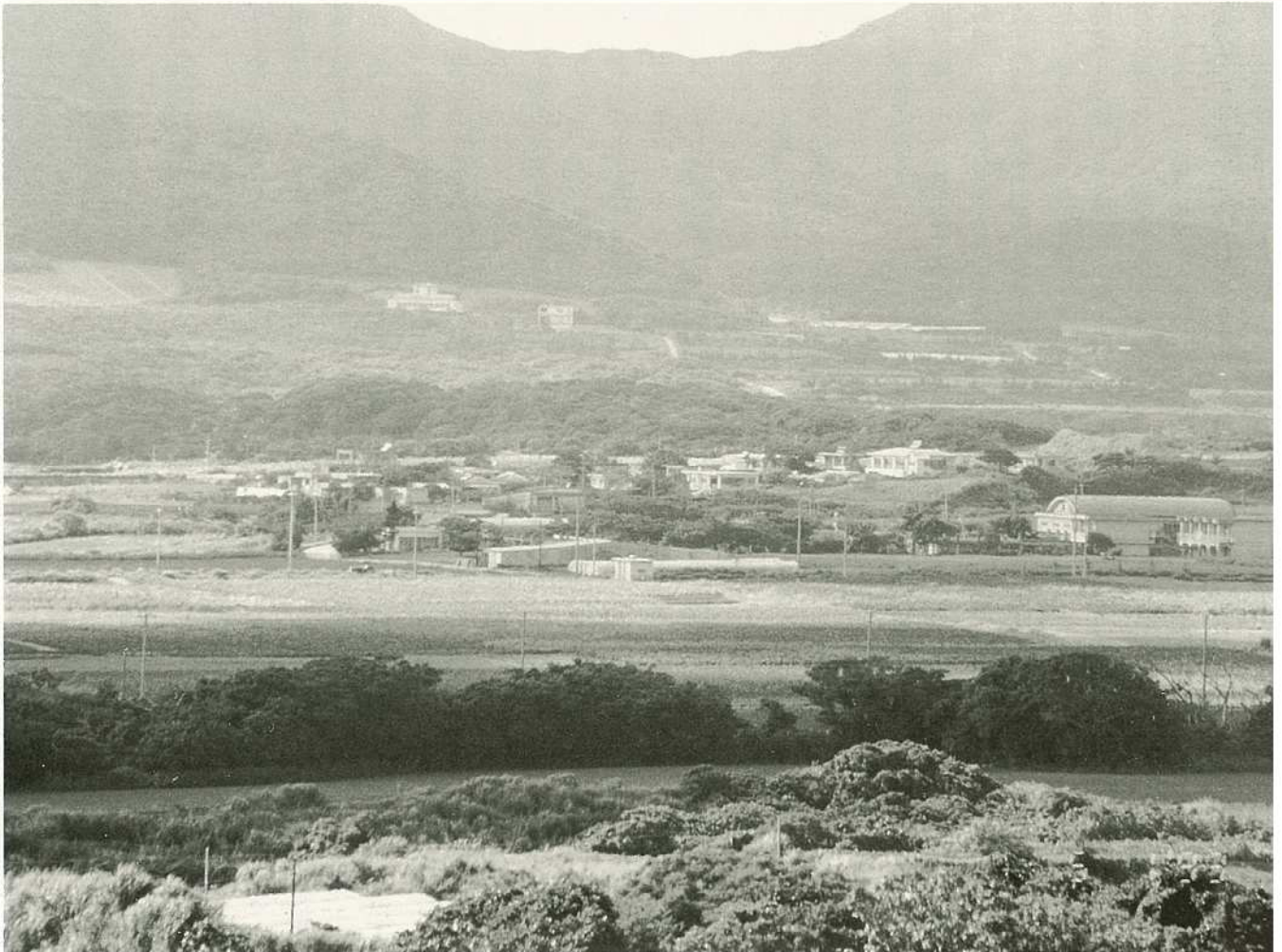
宮良牧中から川原の集落をのぞむ

編集・発行／沖縄県石垣市総務部企画室 石垣市美崎町14番地 ☎(09808)2-9911