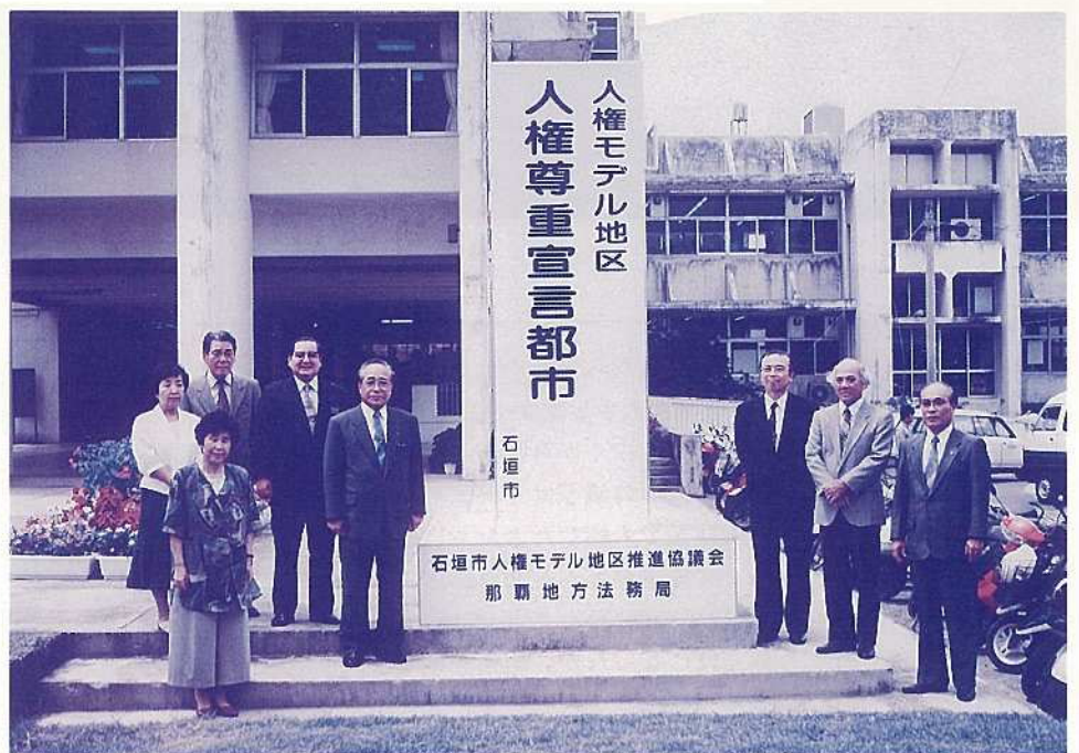
事業の一環として6月18日、四角塔を設置

人権モデル地区協議会は、人権擁護委員、行政相談員、保護司、更生保護婦人会員、子育て相談員、高等学校長、中学校長、小学校長、PTA会長、公民館長、区長、民生児童委員、各種団体の長で構成され、モデル地区活動を実践するための事業計画、予算等について審議しました。主な事業計画は、次の通りです。