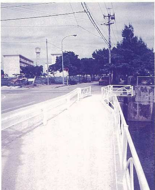
真喜良団地～児童公園の歩道

また、国・県との関係で時間を要する問題については、関係課で鋭意努力しています。その後の処理状況として、一つは、於茂登公民館（第八回）から要請のありました、農村団地の建設については、平成五年三月に竣工し、四月十五日から入居しています。また、双葉公民館（第十九回）から要望のありました、真喜良団地から児童公園への歩道の設置については、平成五年五月二十日に工事を着工し、近く完成の予定です。