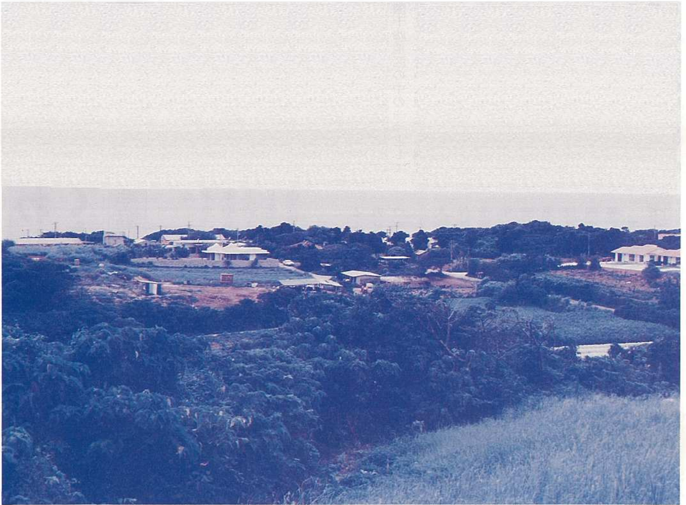
安良山西麓から平久保の集落をのぞむ

編集・発行／沖縄県石垣市総務部企画室 石垣市美崎町14番地 ☎(09808)2-9911