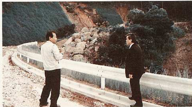
各地で土砂くずれも発生