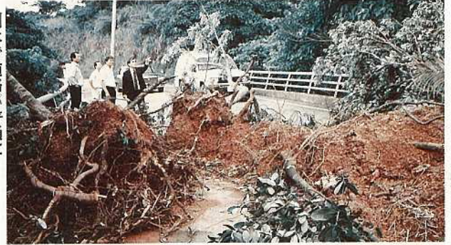
倒木で道路が普通に