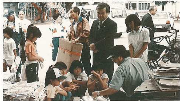
大川公民館で資源ごみ回収を体験