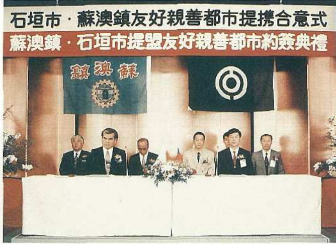
石垣市と蘇澳鎮の行政、各種団体の代表が参加して行なわれた合意式（市民会館中ホール）

石垣市は、これまで歴史的につながりが深く八重山青年会議所が十三年余にわたり人的、文化的交流を進めてきた蘇澳鎮（台湾宜蘭県）との友好親善都市提携の合意式を六月二十八日に市民会館中ホールで行いました。