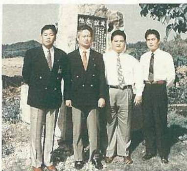
青年会議所のメンバー（平和記念碑の前にて）