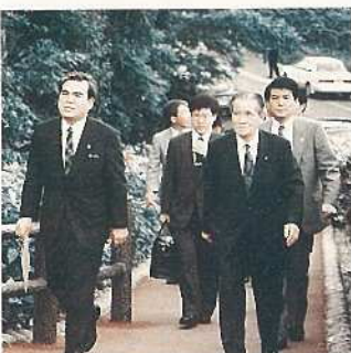
バナナ森林公園を視察