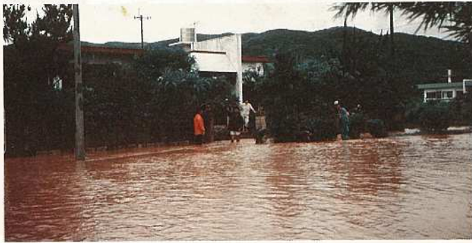
大雨で道路が冠水 (伊野田小付近)