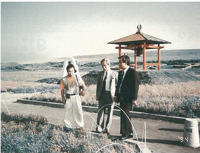
昭和63年2月に国内で最初に設置された稚内市「平和の鐘」