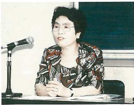
講師の大城県女性政策室長