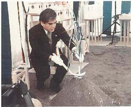
▶ 工事の安全を祈り初めの儀を行う。

これまで、市民から強い要望のあった総合体育館の建設が開始されたことにより市民スポーツ・健康都市づくりの