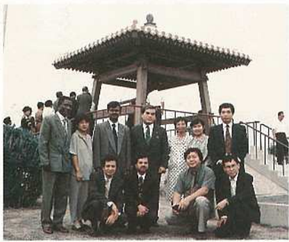
(写真・国際農林水産業研究センターの皆さん)