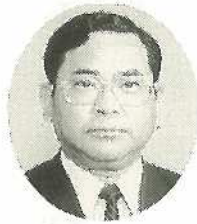
①入嵩西整②53 ③無所属④市議会議員 ⑤新川⑥日本大学 ⑦建設・土木委員