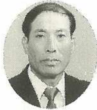
①大立政市②51 ③社大④農業 ⑤大浜⑥大浜中 ⑦経済・民生委員