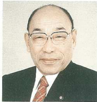
岡崎市長 中根 鎮 夫

石垣市民の皆様、新年あけましておめでとうございます。顧みまずと昭和四十四年、縁あってご当市と親善都市の提携をして以来、今年で、早二十六年の歳月を数えようとしております。この間、産業、文化、教育等各方面にわたる交流が年々深まり、また交流