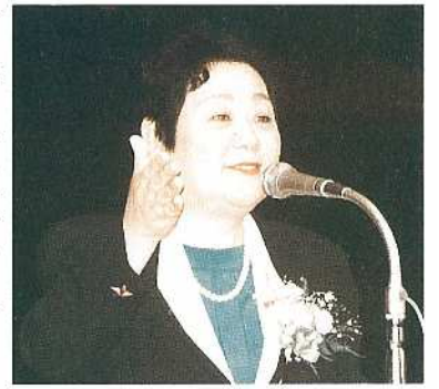
講演を行う東門副知事

男性にとっても、家庭や地域にもこれだけ貢献しているという自信をもってこそこれからの高齢社会に向けて、男