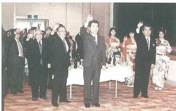
多くの市民でにぎわった 新年祝賀会名刺交換会