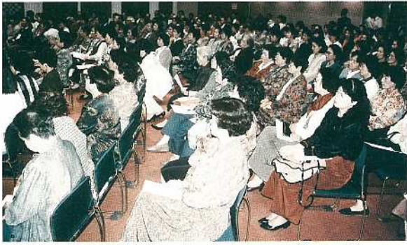
多くの市民が参加した講演会

メリカ社会にいたも同然であったことに気づきました。子どもを育てながら自立している輝いている女性たちがわんさかいる。そんな方の仲間に入りたくと強く願いました。