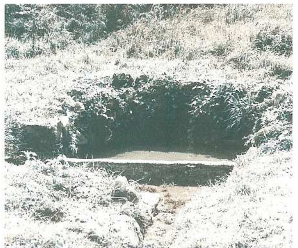
イセーニカー（川平の石嶺井戸）

島の各地には、多くの井戸が今も残っている。そのなかには、個人所有の井戸と各村で共同で利用していた井戸とがある。