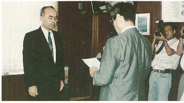
「ゆとり創造宣言都市」決定書が石垣市へ交付されました

この事業は、市民のゆとり創造を進めようとする都市を対象として、その広報啓発活動を支援する「ゆとり創造宣