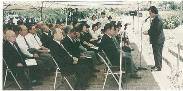
多くの市民が参加して行なわれた鐘打式

現代を生きる私たちに課された責務は、私たちの先人はあの戦争の被害者であったと同時に、海外においてわが国が侵略を行った加害国であっ