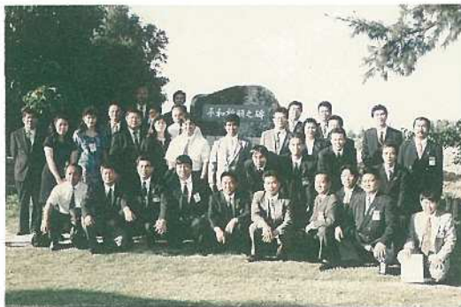
十数年来の交流を重ねた両JICの皆さん（観音堂近くの平和祈願之碑前）

憲法の理念を尊重し、平和の誓いを新たに、この石垣市から平和の心を発信していきましよう。