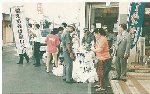
市民へ防災パンフレットを配布

真のゆとりの実現に向け市民の代表で構成する「石垣市ゆとり創造プラン協議会」を設置し、市民生活を豊かで実りあるものにしていくための論