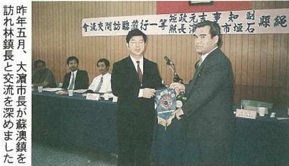
昨年五月、大瀨市長が蘇澳鎮を訪れ林鎮長と交流を深めました

また、七月二十日には林鎮夫婦をはじめ議会、観光・商工会、漁業、経済・文化関係者三十一名が来島し、歓迎交流会や四方字の豊年祭、島内産業視察などを行いました。