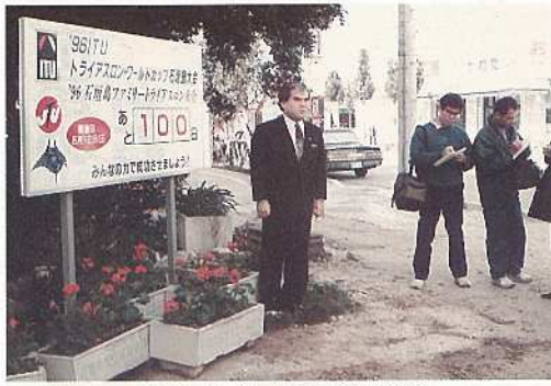
730交差点に残暦板を設置

トライアスロン大会の関心を高めるため、大会までの日数を表示した「残暦板」が市内二ヶ所に装置されました。設置場所は、七三〇交差点の離島栈橋側と市役所玄関前です。 この表示日数は大会関係者が大会まで毎日替えて、カウントダウンをします。