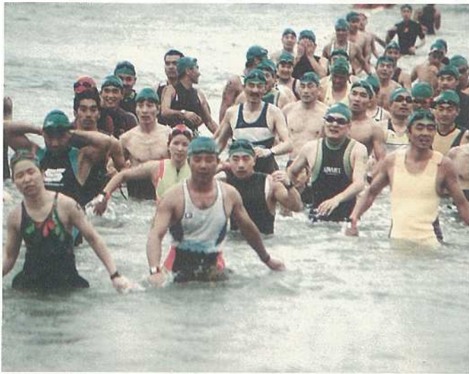
ファミリートライアスロン大会の様相

石垣市は、世界へ情報発信するロケーションの条件が優れ、国際交流を推進する最適な場所であり、国際トライアスロン連合（ITU）においても、ワールドカップ大会の開催に最適な場所であると期待されています。