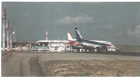
八重山の交通拠点石垣空港

題はあるが、地権者や関係者の理解と協力が得られるならばカラ岳東側よりも早く新石垣空港は造れる」として宮良牧中案を選定しました。