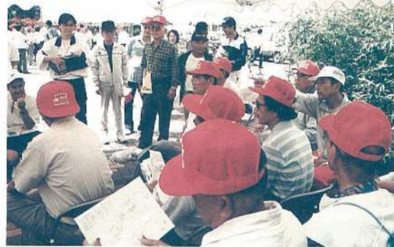
交通規制で説明を受けるボランティアの皆さん