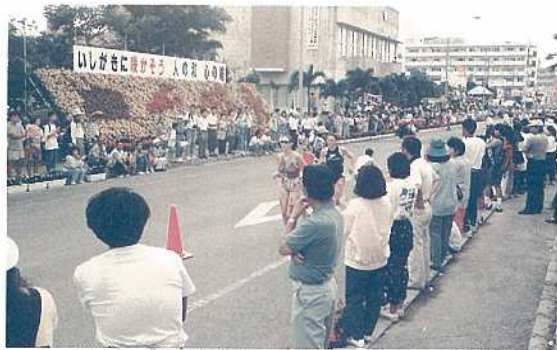
沿道では市民が声援を送る

する過酷なスポーツであり、自然の中で自らの肉体の限界に挑戦する姿は、多くの人々に深い感動と勇気を与えてくれます。