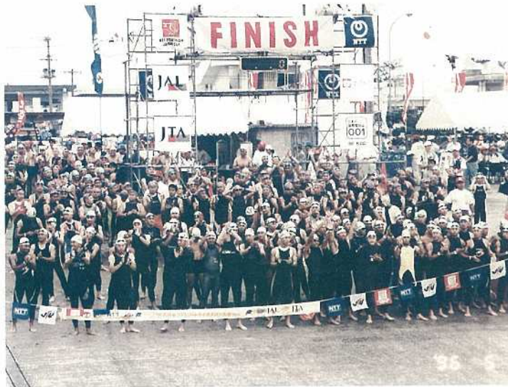
ファミリーの部、スイムスタート前の緊張の一瞬

国内トライアスロンシーズンの開幕を告げる「'96トライアスロンワールドカップ石垣島大会&石垣島ファミリートライアスロン大会」(主催・同大会組織委員会)は五月十二日に開催されました。