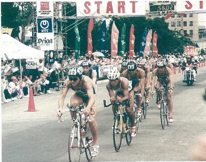
バイクで市民会館前を通過するW杯男子選手