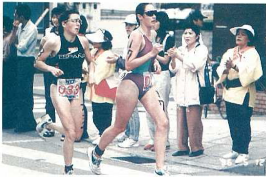
デッドヒートを繰り広げる女子選手

する過酷なスポーツであり、自然の中で自らの肉体の限界に挑戦する姿は、多くの人々に深い感動と勇気を与えてくれます。