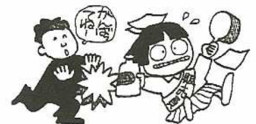
※被害者が、やがて加害者になることも多い。

元の同じ高校を卒業した同級生からの誘いがきっかけとなって業者にマインドコントロール(洗脳)されていた息子を家族の協力で、無事解決することができました。