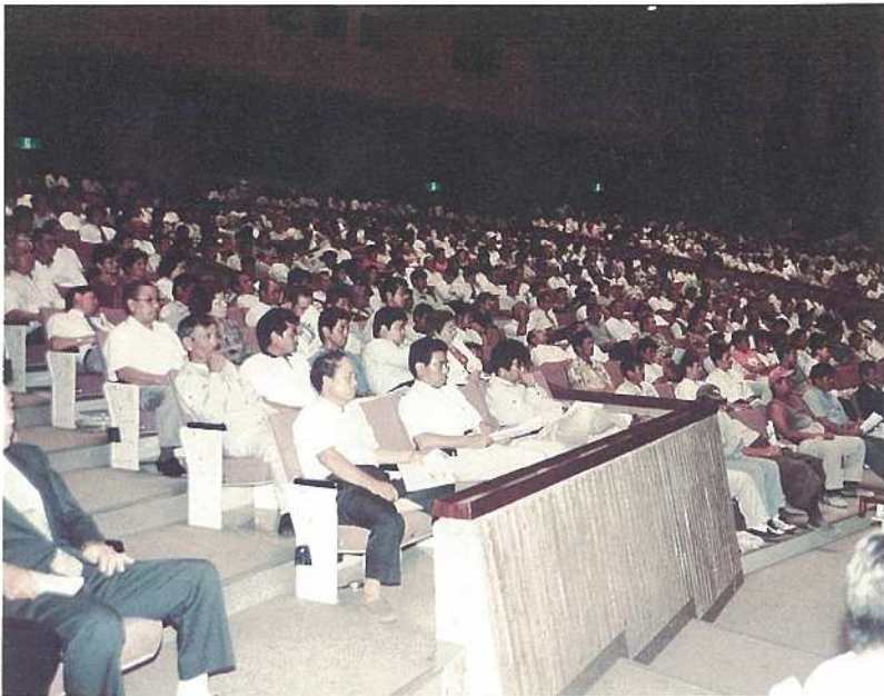
多くの市民が参加し、新空港問題解決への決意を新たにしました