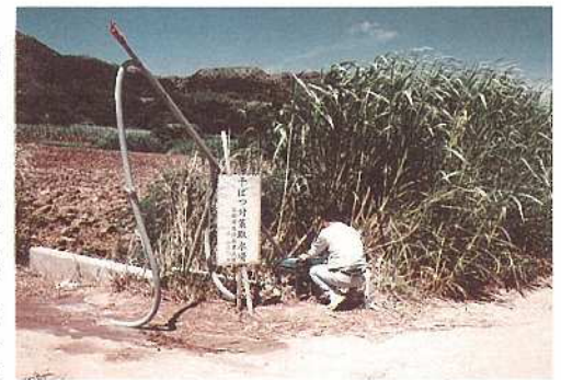
干ばつのため設置された取水ポンプ