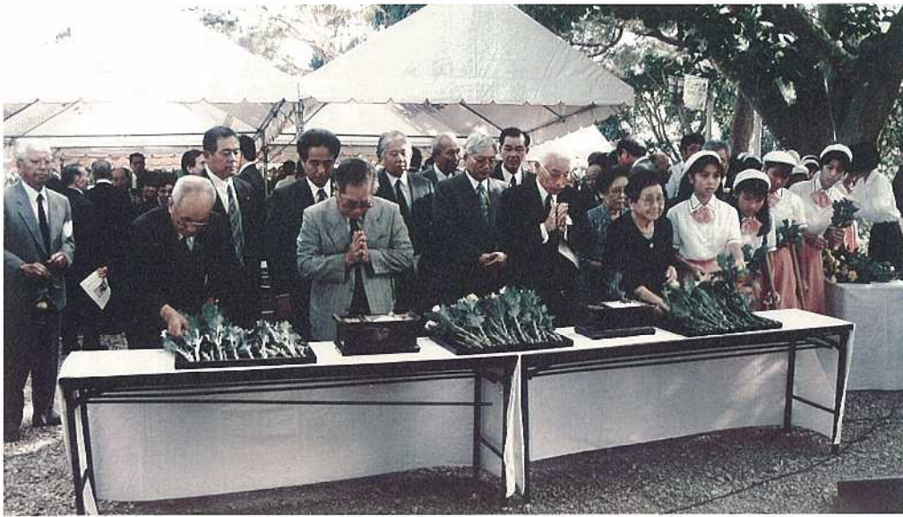
参列者が献花と焼香を行いました