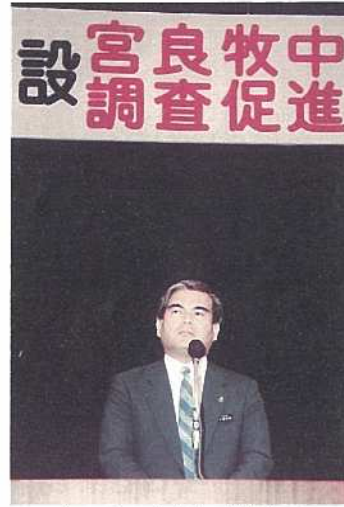
あいさつを行う大濱市長