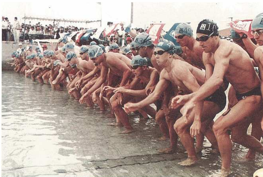
大浜博吉さんの作品