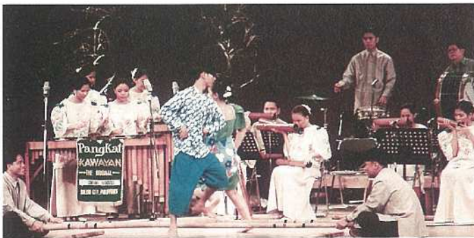
フィリピンのパンカットカワヤン

先人たちは天恵のこの立地と風土の中で多様な独自の芸能を創り発展させてきました。石垣市では、先人の残した文化遺産を継承発展し、近隣のアジア諸国と芸能文化の交流を深め、本市の芸術文化の創造・発展を図ることを目的に昭和六十三年から「アジア民族芸能祭」を開催してまいりました。