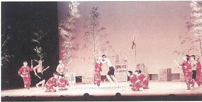
台湾の泰雅部落芸術団

石垣島は琉球列島の最西南端にあって、広くアジアに開かれた文化の交流と発信の拠点として、大きな可能性を秘