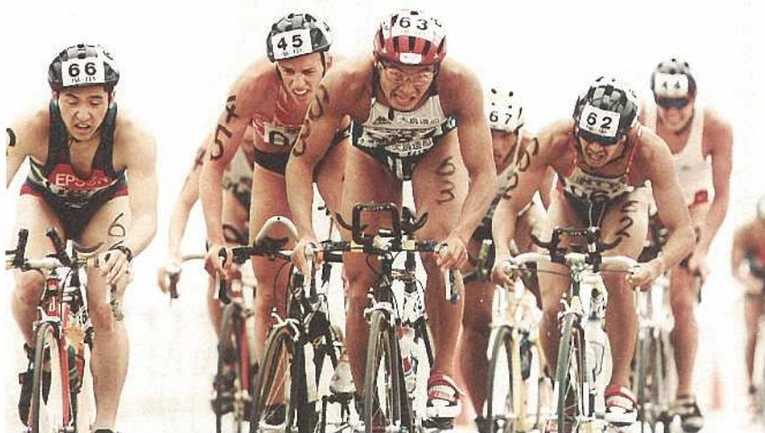
喜友名朝昭さんの作品