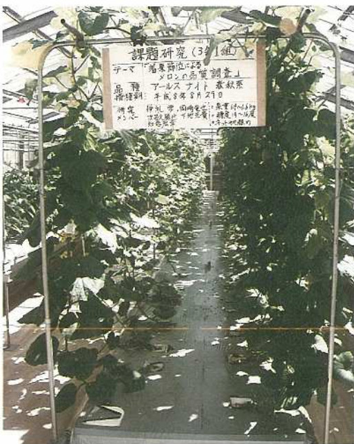
メロンの課題研究施設

石垣市においては近年、施設栽培農家が増加傾向にあり、熱帯花キ類、熱帯果樹類をはじめ野菜の生産量も増加しつつあります。