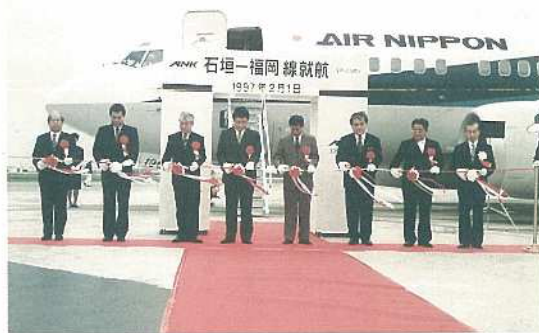
福岡直行便を祝ってテープカットが行なわれました

九州バガースマの会の会員をはじめ観光客等百二十四人であり、八重山民謡愛好会による「安里屋ユンタ」の踊りに迎えられました。