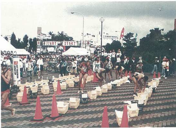
昨年の大会から（トランジションエリアで靴にはきかえるワールドカップ男子選手）

国内トライアスロンシーズンの開幕を告げる「'97 ITUトライアスロン・ワールドカップ石垣島大会&'97石垣島ファミリートライアスロン大会」（主催・同大会組織委員会）が四月十三日に開催されます。 石垣島は、世界へ発信するロケーションの条件が優れており、国際交流を推進する最適な場所であると期待されています。 昨年の五月十三日に開催された大会では、体力の限界に