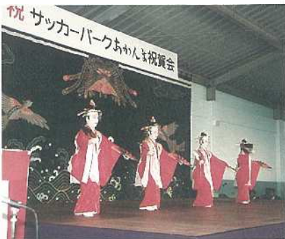
祝賀会では「赤馬節」が踊られました