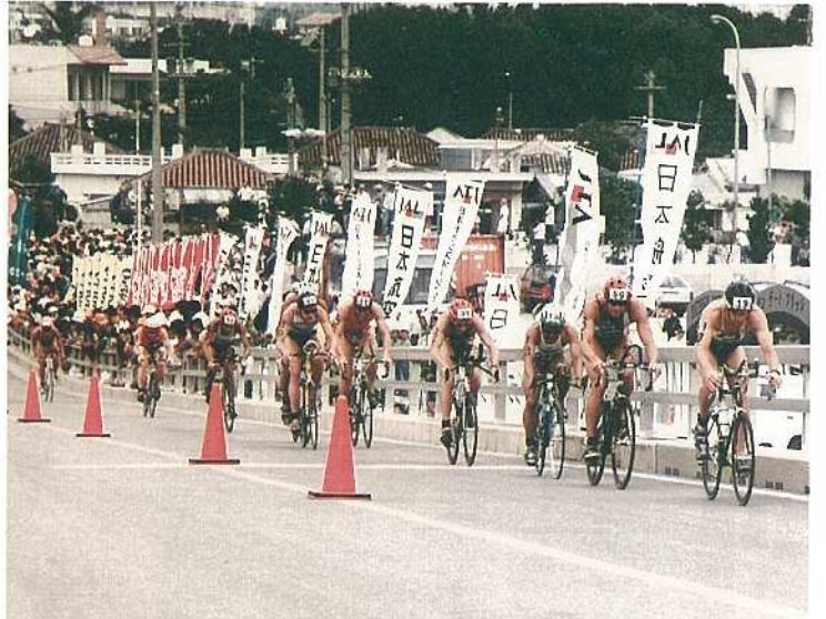
昨年の大会から（サザンゲートブリッジをバイクでかけ上げる選手たち）

自転車などを設置する「トラッシュジョンエリア」「受付業務」「通訳」などを行うボランティアです。 ボランティアについての問い合わせは市役所内のトライアスロン事務局へお問い合わせ下さい。 石垣市役所観光課トライアスロン事務局 ☎ 2-1212