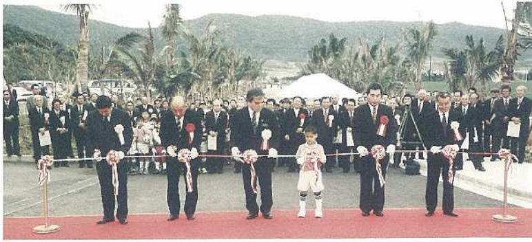
正面玄関前で行なわれた テープカット