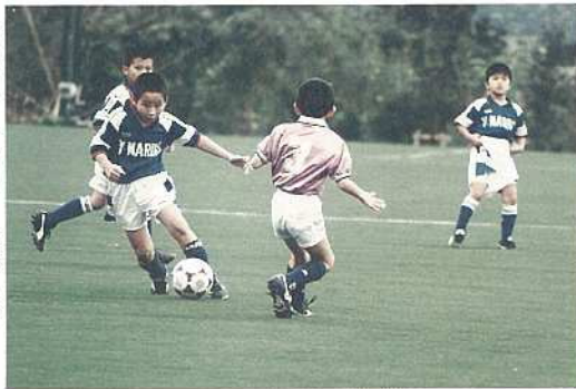
思い切りサッカーを楽しむ 小学生プレイヤーたち