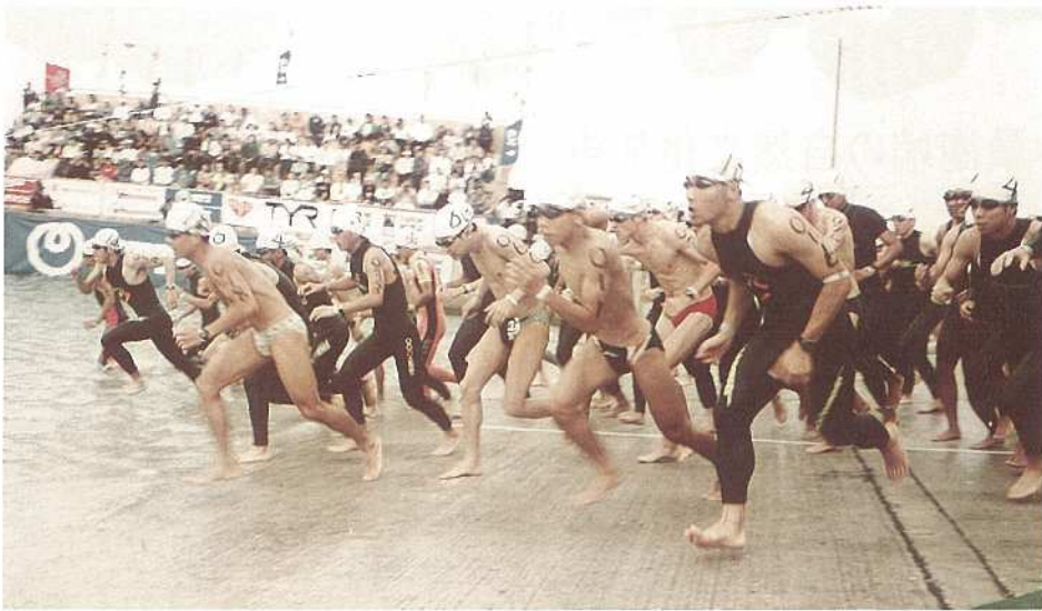
ファミリーの部スイム競技のスタート