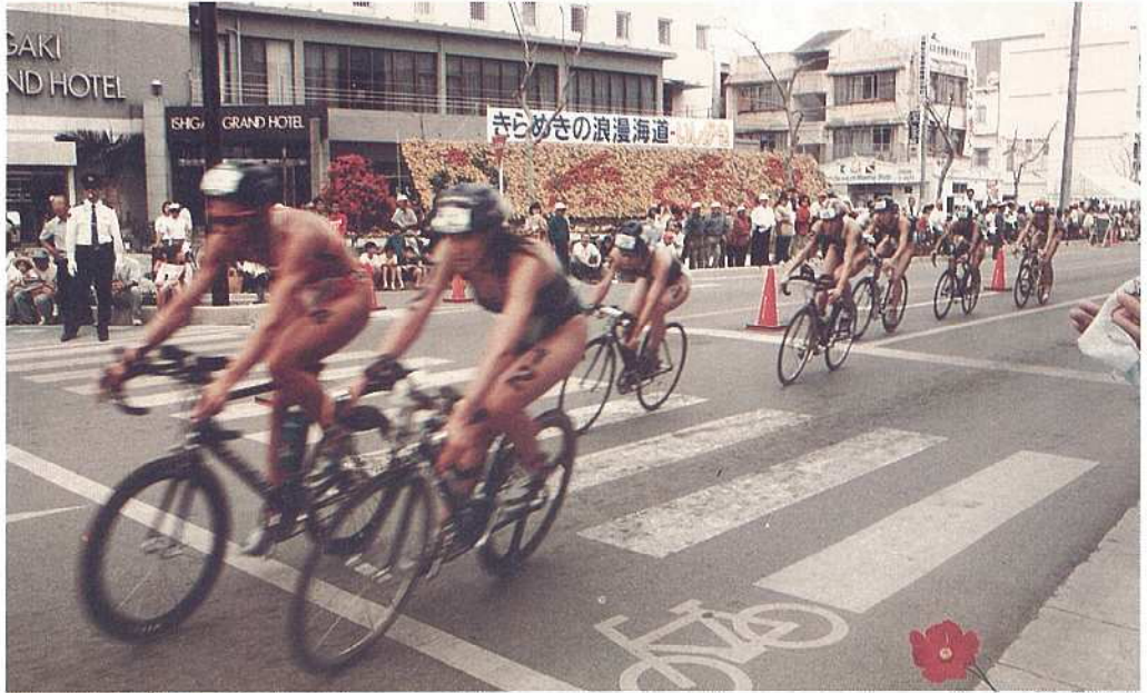
ワールドカップ女子バイク競技

ワールドカップ女子は三十五人が出場し、バイクとランで力強いレース運びをしたエマ・カーニー選手（オーストラリア）が二時間二分五秒で優勝し、二連覇を果たしました。日本選手では、庭田清美選手が六位に入賞しました。男子は五十七人が出場し、クリス・マコーマック選手（オーストラリア）が昨年の優勝者のマイルス・スチュアートの（オーストラリア）選手に二十秒の差をつけて一時間四十分八分十二秒で優勝しました。