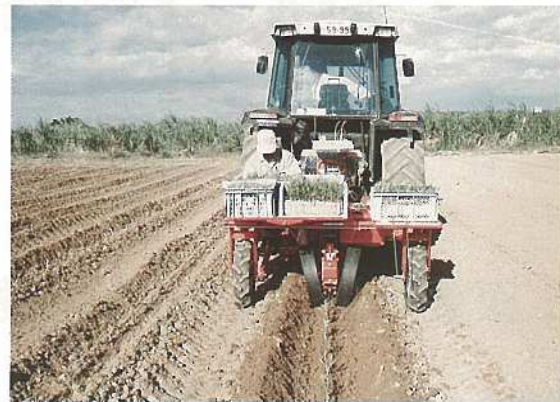
側枝ポット苗の移植作業