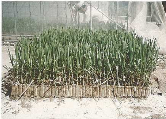
挿芽して3週間～4週間