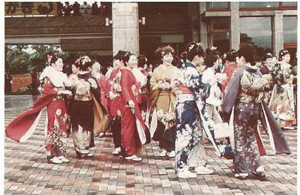
国民年金は20歳から