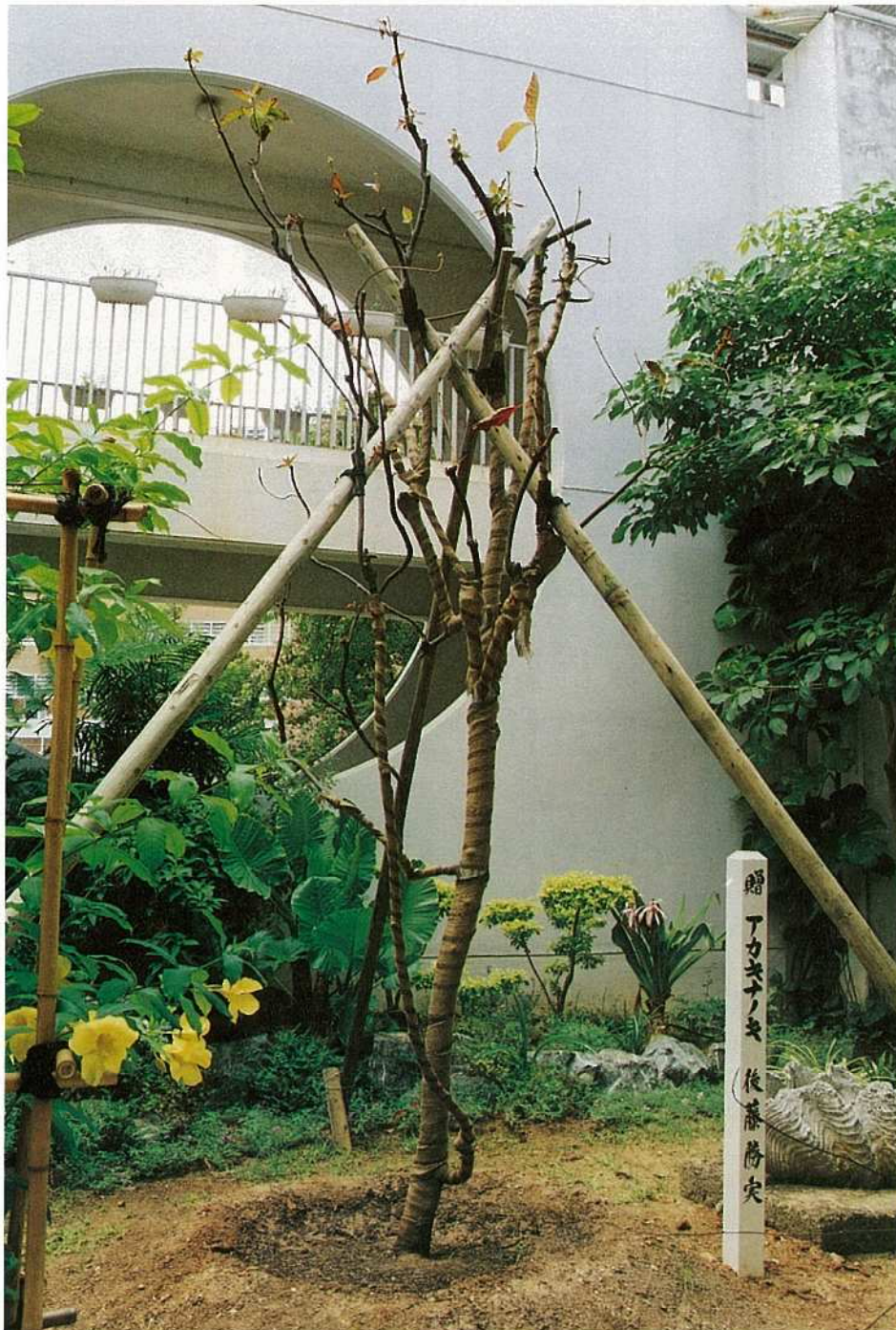
マラリア治療薬の原料木を植樹