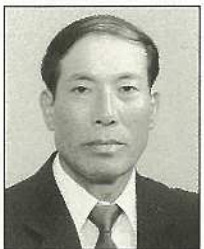
大立 致市 大浜77番地の1 (55) 沖縄社会大衆党