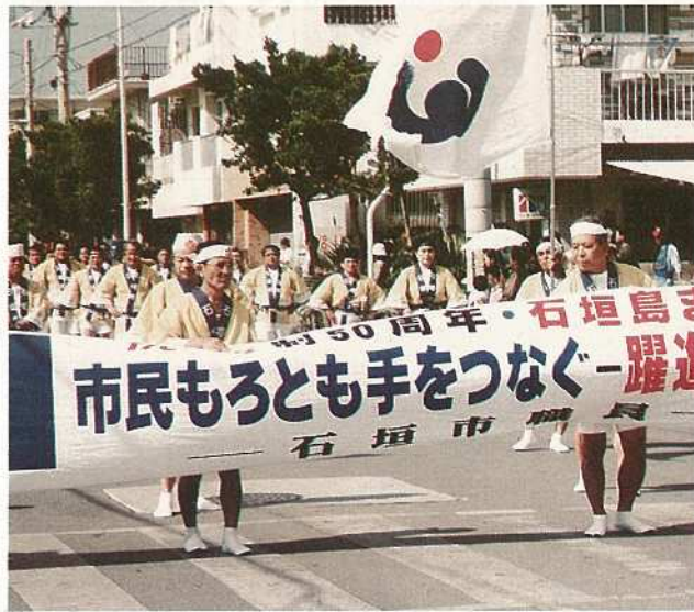
昨年の石垣島まつり

また、「国際民族芸能祭—いしがき98」が同時開催され、国際色豊かな民族舞踊がくり広げられます。