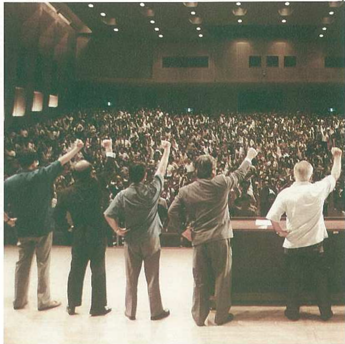
多くの市民が参加し、新空港早期建設を訴えました

新石垣空港宮良牧中建設を進める会、石垣市、竹富町、与那国町は、八月三十一日に市民会館大ホールにおいて「新石垣空港建設危機突破郡民大会」を開催しました。 新空港建設問題については、六月定例会市議会において新空港設置管理案件が否決されました。また、建設業界で倒産が相次ぐなど、地域経済上も深刻な状況にあります。