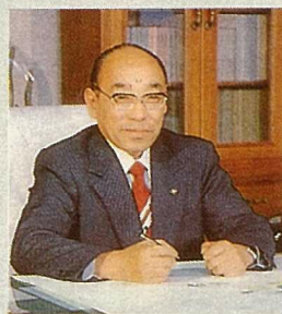
岡崎市長 中根 鎮 夫