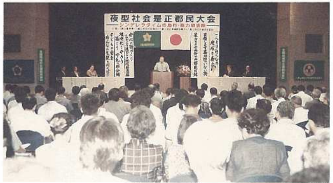
多くの市民が参加した郡民大会