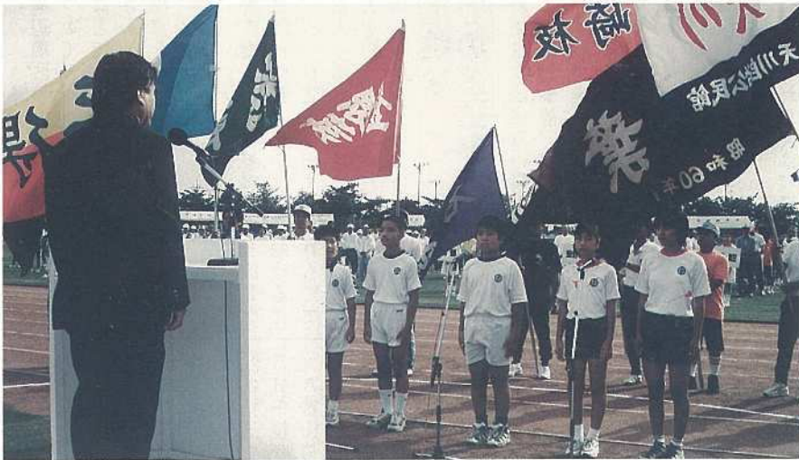
明石小の皆さんが元気に選手宣誓

をつくるために行われたもので、小さな幼児からお年寄りまで多数の市民が参加して多彩なプログラムを楽しみました。 市民生活とスポーツの係わりをさらに強くしていつでもどこでも、だれもが気軽に楽しめるスポーツを盛んにし、健康都市づくりに力をあわせましょう。