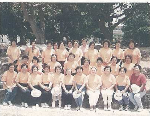
健康づくりをめざすヘルスマイトの皆さん