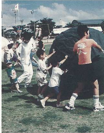
力をあわせて大玉ころがし

自らの健康管理や体力向上についての関心が年々高まっております。そのような中で、十六回目を迎えた石垣市民大運動会が十月十一日に中央運動公園陸上競技場で開催され、秋晴れの空の下で参加した市民がさわやかな汗を流しました。