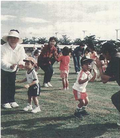
お母さんと楽しくおゆうぎする子どもたち