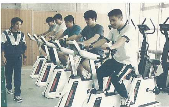
総合体育館トレーニング室

ムページを開設し、各公共施設の活用や情報交換に役立つために活用されています。インターネット上には市総合体育館、サッカーパークあかま、伊野田オートキャンプ場、米原キャンプ場などの施設案内や料金一覧表が掲載されています。