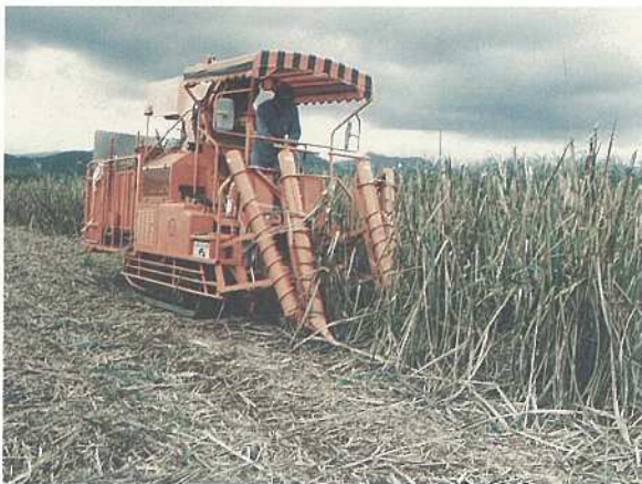
新機種のキビ刈取機