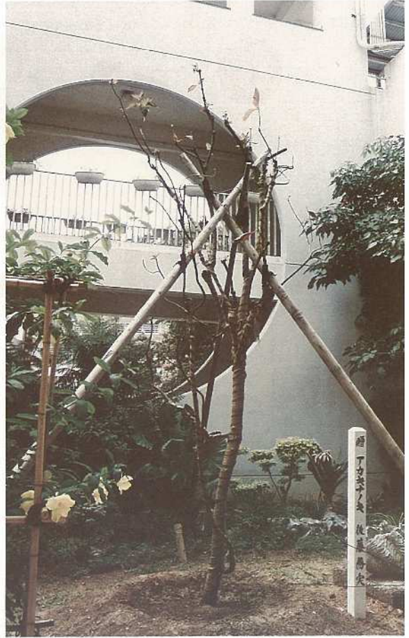
アカキナノキを植樹