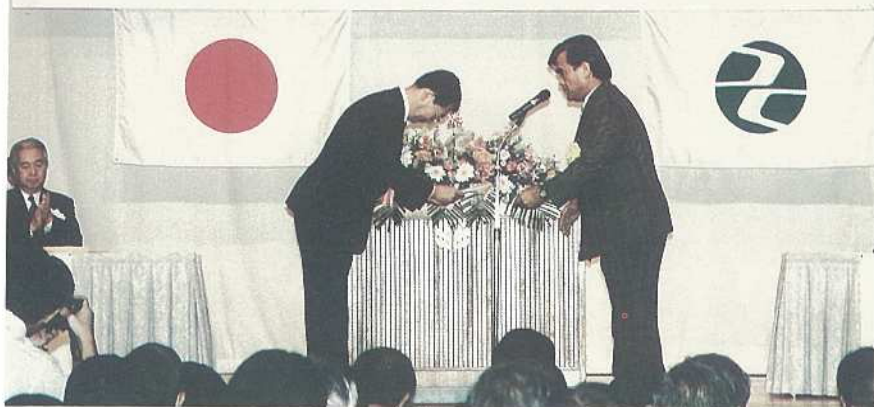
関係者多数が出席した完工式典