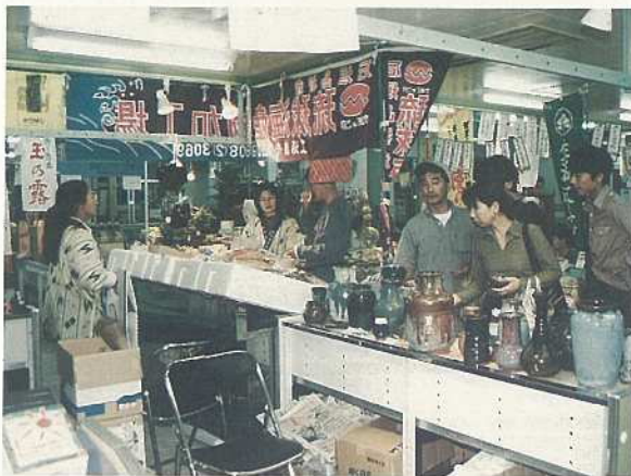
特産品展示センター公設市場でオープン