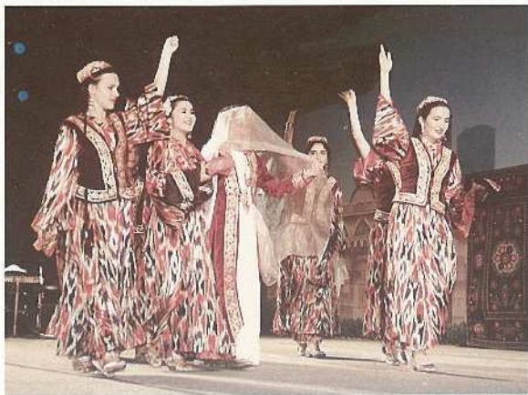
国際民族芸能祭を開催（ウズベキスタンの踊り）