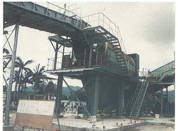
石垣島製糖で脱葉施設完成