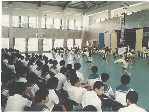
石垣第二中学校体育館が完成