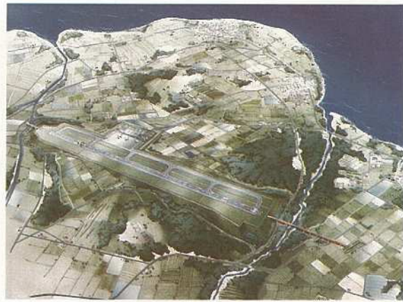
新空港建設予想図