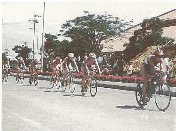
石垣島トライアスロン大会(ワールドカップ女子のレース)