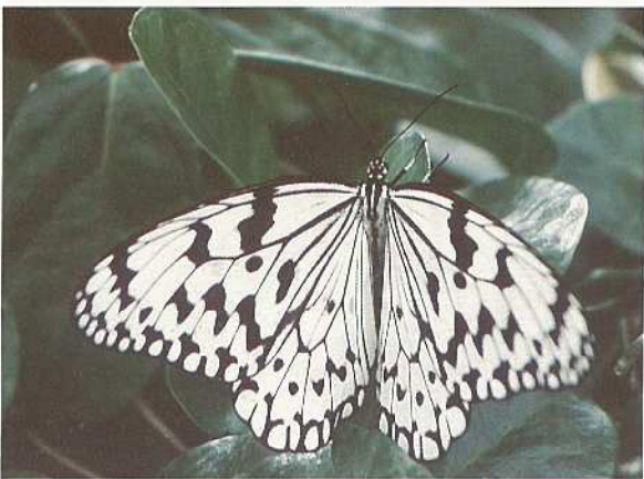
おおごまだらを育てる会発足