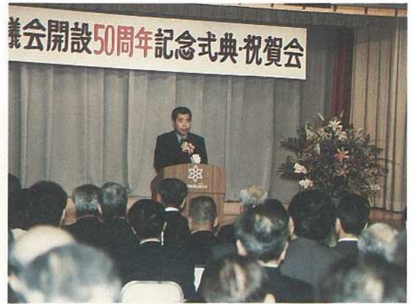
石垣市議会開設50周年式典