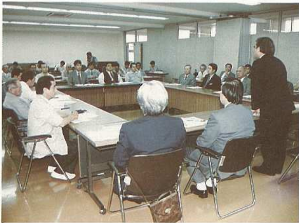
新空港建設を進める会発足