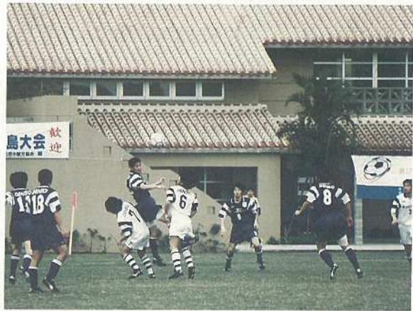
全国の大学生が参加したデンソーカップ