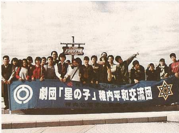
星の子劇団稚内公演