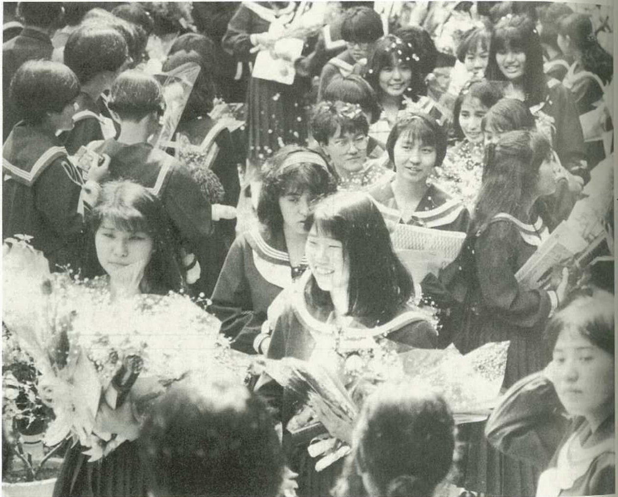
▲後輩に見送られ学び舎を後にする 卒業生(八重山高校)

編集・発行 / 沖縄県石垣市総務部企画室 石垣市美崎町14番地 ☎(09808)2-9911