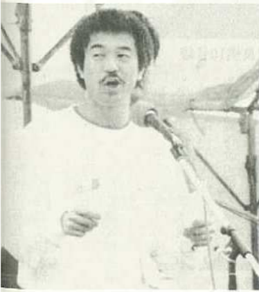
海びらきを称える賛歌を朗読する 元プロボクシングチャンピオンで 石垣市名誉市民の具志堅用高さん