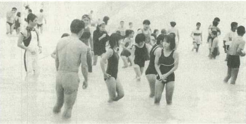
▲あいにくの雨にもかかわらず、大勢の市民、観光客が初泳ぎを楽しんだ＝底地ビーチ