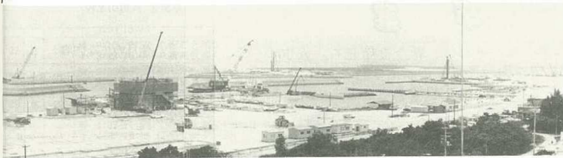
▲登野城漁港整備及び陸上機能施設が完成

(水産課) ・石垣市水産業振興計画基礎調査 昭和五十九年度より継続調査を実施しており、今回は石垣島周辺海域の赤土による汚染状況調査。事業費四百九十万円 ・水産業構造改善特別対策事業 登野城漁港の完成に伴う陸上機能施設(製氷、貯氷、冷蔵、魚船用補給施設) 事業費一億九千八百九十九万円 ・漁村地域活性化緊急特別対策事業 登野城漁港第三船揚場の新設に伴う漁船修理保全施設。 事業費六百四十一万四千円 ・漁港整備事業 登野城漁港改修事業(波除堤防波堤、船揚場、道路等) 事業費四億五千一百一十六千円 ・シャコ貝放流事業 年々、枯渇化が進むシャコ貝資源の増産を図り、「豊かな海づくり」にめざす。 事業費二百万円 (商工観光課) ・唐人墓修景緑化工事 唐人墓周辺の修景緑化(芝、マチク、オオゴンガジュマル、ソテツを植栽) 事業費一千五百五十万円 ・玉取崎展望台施設整備工事 玉取崎展望台の改修及び、ハイビスカス丘を整備。 事業費三千六百四十三万円