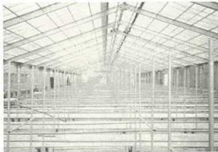
▲栽培施設H鋼ハウス4棟が完成

(農政課) ・農業構造改善事業 花卉温室施設 洋ラン(デンファレー)の栽培施設として日鋼ハウス(二三、一〇四平方メートル)の八棟を計画。そのうち今年度は四棟が完成。平成元年度は五万六千本の出荷を計画している。 事業費六千五百十万円 ・野菜産地総合整備対策事業 冬春期の県外出野菜(スイカ)の安定生産を図るため、共同栽培施設としてパイプハウス7団地を設置し、品質向上と産地下を推進。 事業費六千六百六十四万六千円 ・さとうきび生産総合改善事業 ミニドラム脱葉機一セットを導入。収穫作業の省力化を推進し、作業の共同化を図る。