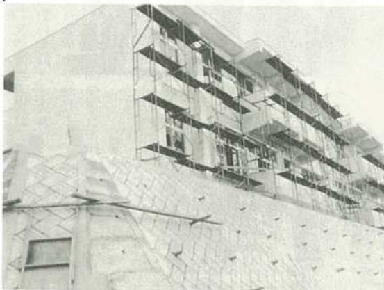
▲吉原小学校校舎新増築