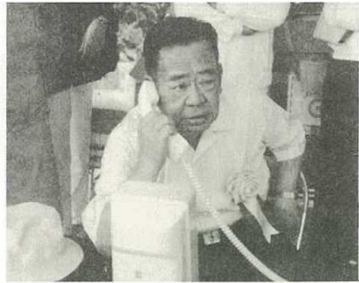
▲友好都市・稚内市の浜森市長と 記念通話する内原市長