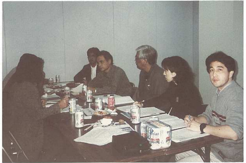
各団体との交流を行った「いしがき未来塾」のメンバー

シマおこし研修発表会（地域づくり団体沖縄県協議会主催）が二月十二日、平良市において行われ、県内各地で地域づくりに取り組む関係者約七十人が参加しました。石垣市からは、いしがき未来塾生ら三十人が参加、竹富町役場、八重山農業改良センター職員も参加しました。