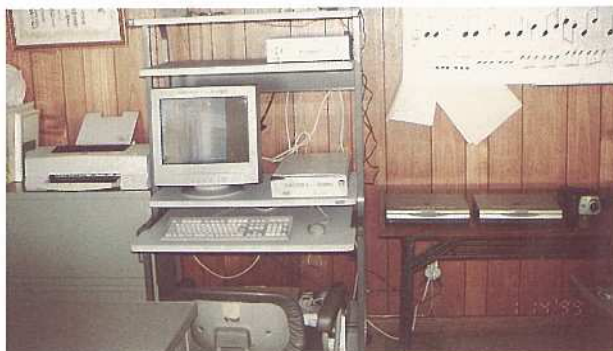
消防団活動のために使われるパソコン機器

石垣市消防団では、パソコンを活用して、消防団報「まとい」の編集や消防団の資料、文書等の記録を作成することにしております。