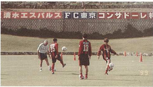
新しいシーズンに向けて汗を流す各チームの選手