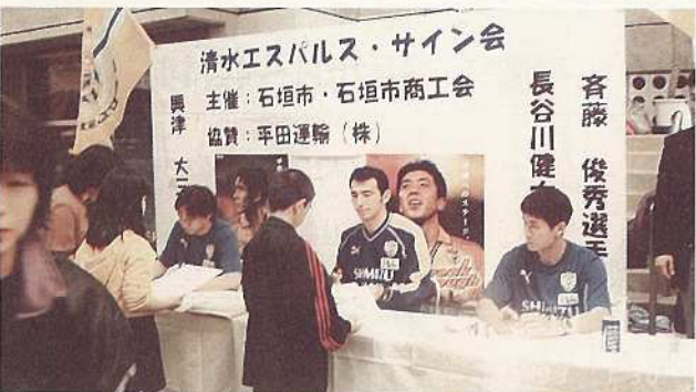
清水エスパルスの選手によるサイン会も行われました