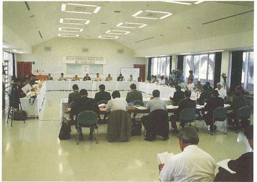
地元委員28人が参加して開かれた地元部会 ↑ ↓