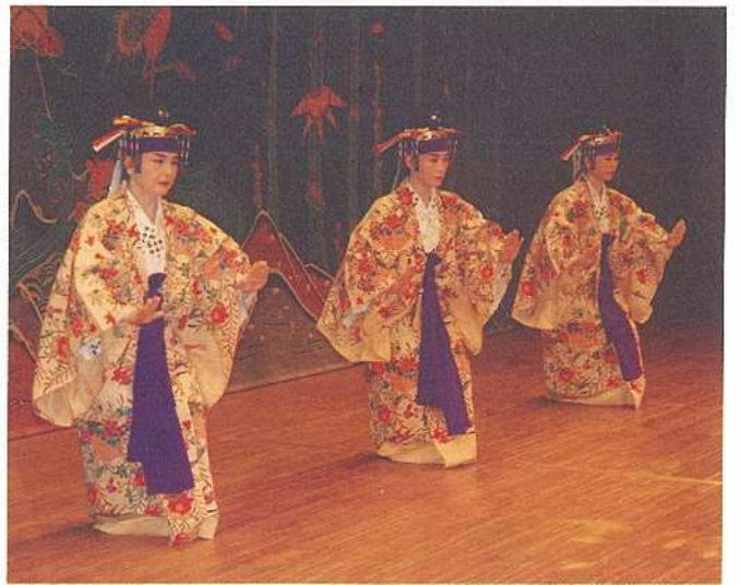
写真はいずれも郷土芸能の夕べから