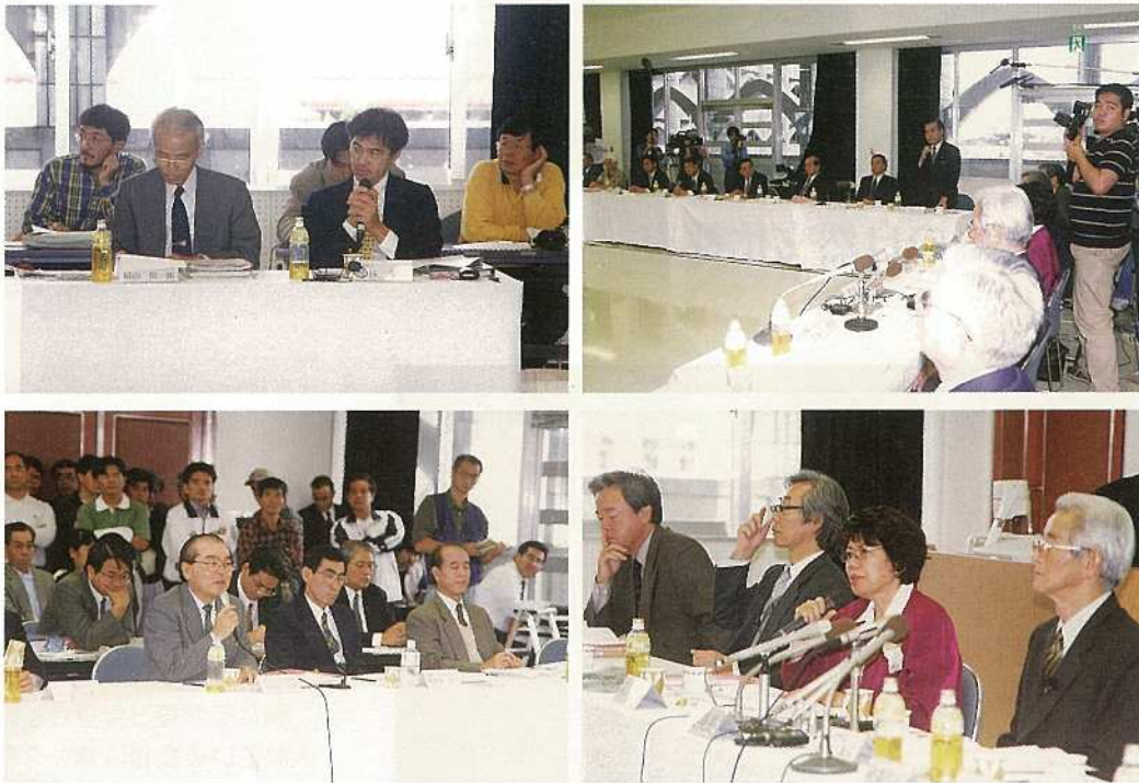
各委員の評価と審議によってカラ岳陸上案を選定した 新空港建設位置選定会(3月11日)