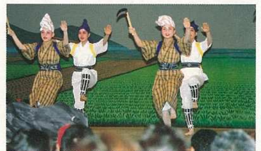
地元三高校の八重山舞踊

その中で地元三高校の郷土芸能クラブは、「生活（くらし）」をテーマに「山入らば」「マミドーマ」「黒島口説」などを演じ、八重山地方に古くから伝わる農作業や漁獲風景