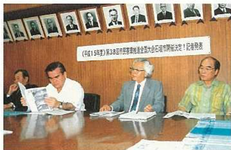
全国大会開催で記者会見を行う宮里会長(中央)と大濱市長