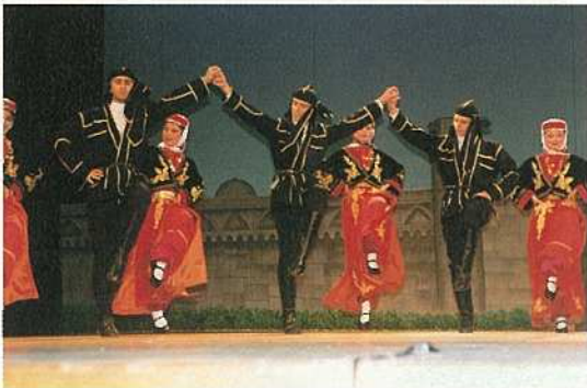
写真上から ニュージーランド、スリランカ、トルコ各国舞踊団の演舞