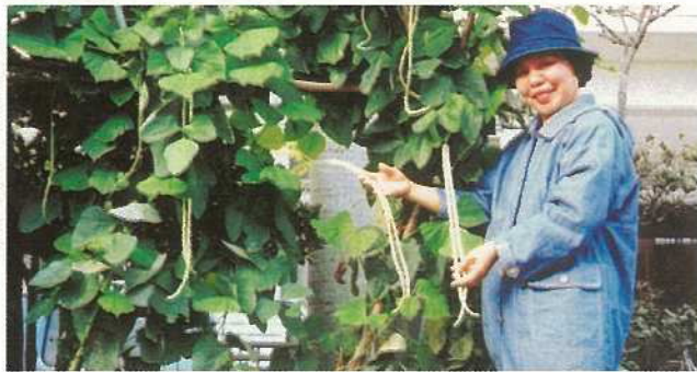
土着園培養土で野菜づくり