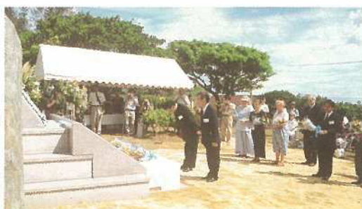
米兵三名を追悼する参列者の皆様

去る、八月十五日は終戦から五十六回目の終戦記念日です。今回は二十一世紀最初の記念日となりました。 その日は、石垣市において特筆すべきことがありましたので、そのことについてお話しいたします。戦時中、捕虜となったアメリカの飛行兵三名