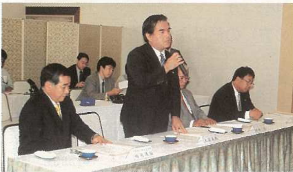
石垣市から三項目の要請を行った大濱市長