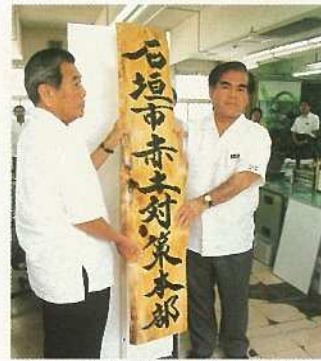
赤土対策本部設置で看板を設置