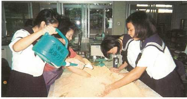
土着園の培養作業を行うクラブ員の皆さん

受賞することができたのも地域の方々や先生方のおかげだと思えます。この賞を頂いたことで、私たち家庭クラブ員は大きく成長することができました。これからも環境保全に努めていきたいと思えます。