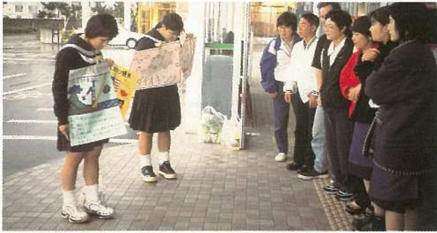
各地区の婦人会や事業所を巡り取り組みを説明