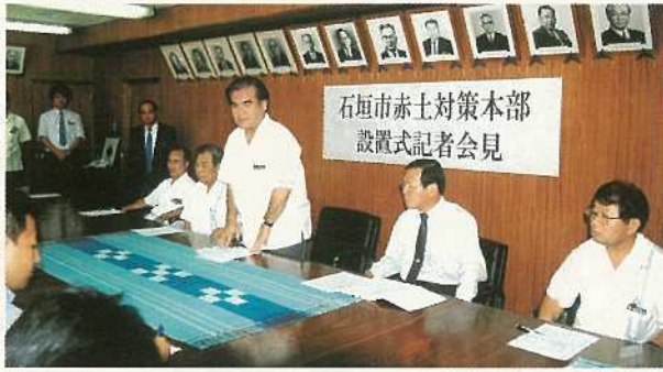
記者会見で石垣市の取り組みを話す大濱市長（中央）