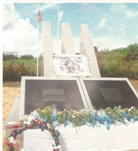
観音堂近くに建立されたモニュメント