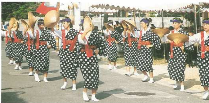
婦人たちが次々と芸能を奉納しました