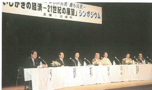
石垣の経済振興について提言・意見交換が行われたシンポジウム。

ました。流通やIT、観光関係あるいは農業や水産業のそれぞれの分野で活躍されている専門家の方々が石垣市の経済の振興について大いに話し合いをしてくださいました。シンポジウムという形式もあってあまり時間がなかった 発想が大事で、それにはどうしても第一次産業の健全化に目が向けられます。農業や水産業、畜産業を振興させ、その上で自然や様々な環境等が守られて、文化がしっかりと根ざし、その上に多くの観光産業や様々な自然を相手とし