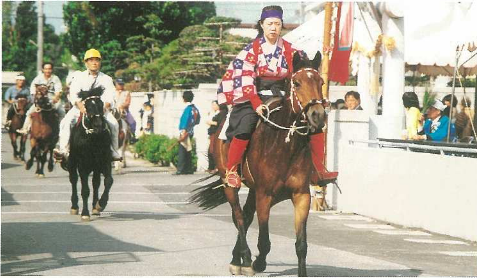
凛々しい姿の女性が手綱をさばく花馬が登場したカタバル馬