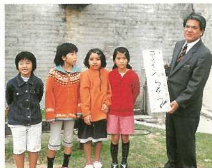
所に設置しました。

市都計課では早速、「ゴミをへらそう」「ゴミをすてないでください」などと書かれた看板を新菜公園など市内四方