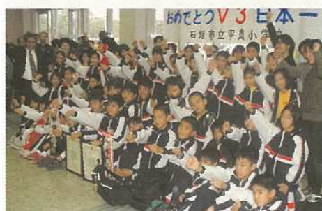
平真小は三年連続日本一に輝いた。