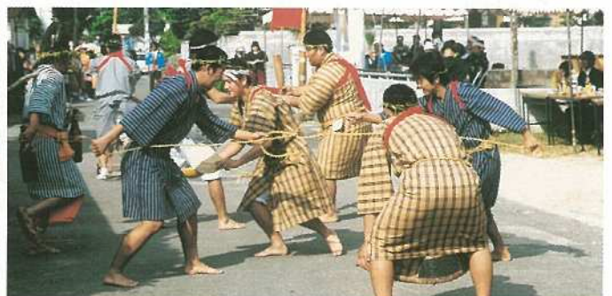
平得青年会が奉納した稲摺り節