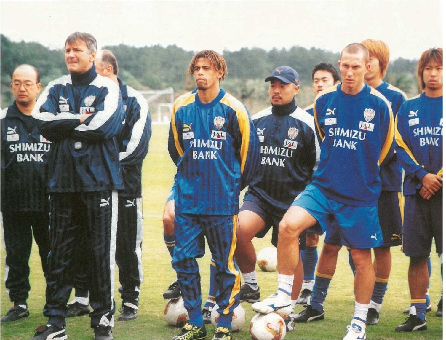
サッカー天皇杯優勝の清水エスパルスイレブンの勇姿。6度目の石垣キャンプ(サッカーパークあかま)で、3月3日のJリーグ開幕に備えました。FC東京とともに今シーズンの活躍が期待されます。