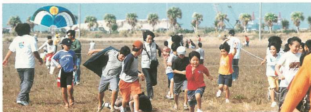
大会一の大凧に挑戦する真喜良小4年生児童たち。

に恵まれ青空いっぱいたくさん凧が舞いました。茨城県、埼玉県、愛知県、静岡県、福島県、読谷村、竹富町など島外からの参加もあり盛り上がりしました。 今年の大大会では、学級や学年の団結やチームワークを表現した連凧が目立ち、いくつも連なった色鮮やかな凧が大空を飾りました。伝統の八角やピキダーに自由凧なども大