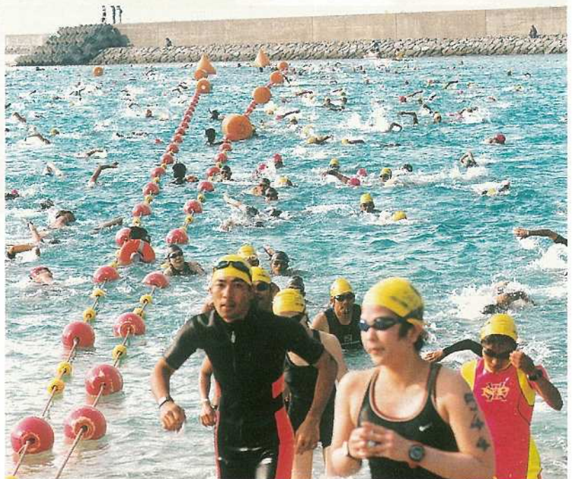
登野城漁港内で行われたスイム競技(石垣島トライアスロン)。