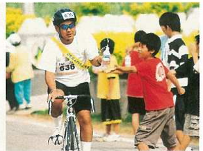
多くのボランティアが、選手たちの熱い闘いを支えました(石垣島トライアスロン)。