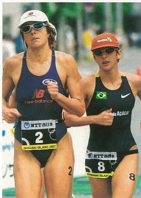
最終のラン競技で熱闘を繰り広げる 世界トップのアスリートたち(W杯)