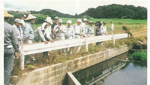
沈砂池の現状を調査する関係者

石垣島赤土流出防止協議会、石垣島周辺海域環境保全対策協議会のメンバーなど八十人余りが参加しました。まず、水岳ファームポンドより轟川流域を展望。特に高台にある裸地状態の農地から赤土が轟川に流れる地形の様子がよく分かり、裸地解消策として土づくりを兼ねた緑肥作物などの植栽奨励が指摘されていました。