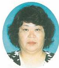
美崎町・浜崎町地区