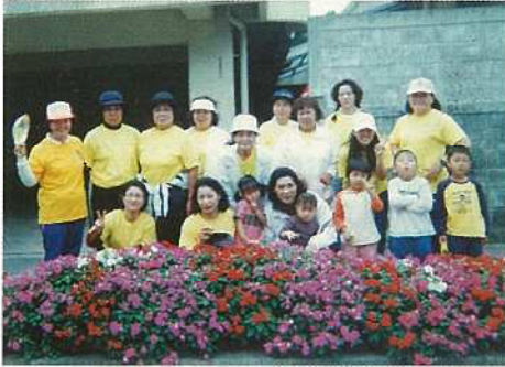
団体の部 白保婦人会

平成三年度より国道沿いの花いっぱい運動を実施、活動を通して集落内の環境美化運動にも取り組んでいる。現在では、青年会や公民館とも連携をとりながら地域活動を展開している。