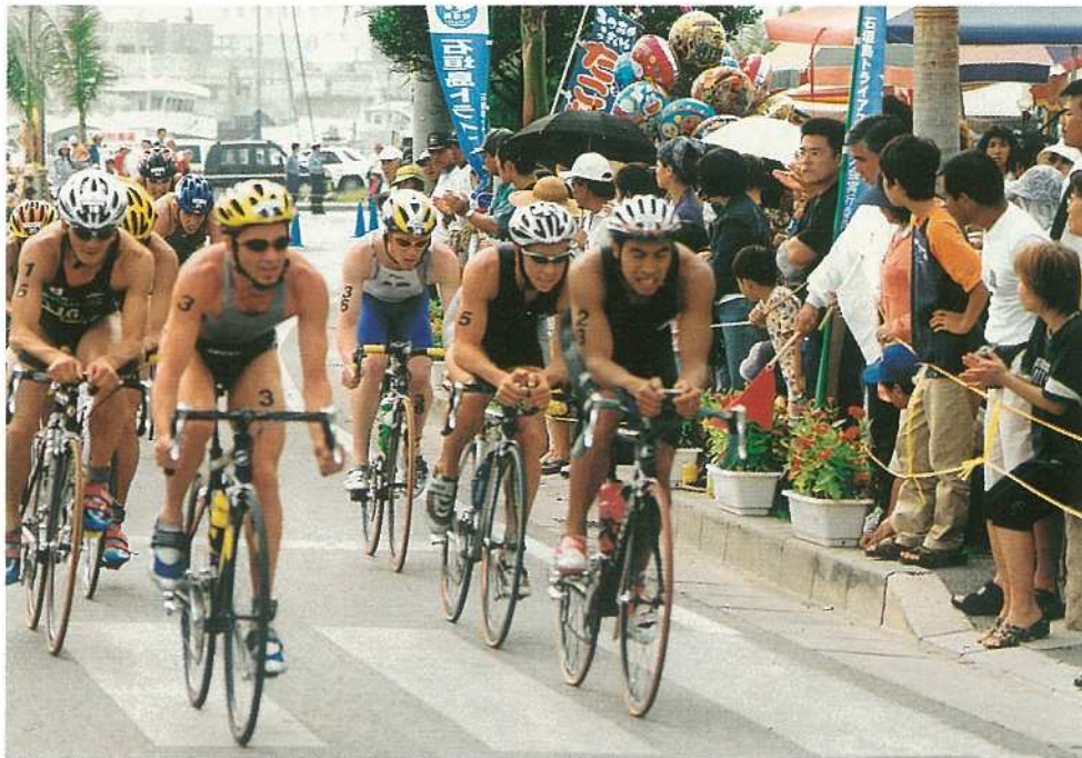
スピード感あふれるバイク競技。沿道の市民の応援にも熱が入りました(W杯)