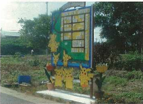
団体の部 真栄里ニュータウン自治公民館

きれいな学校、体験学習の推進を目標に掲げ環境美化に取り組んでいる。正門前ロータリーの花いっぱい運動や月一回のクリーンタイムでは集落内清掃を実施し地域活動も行っている。