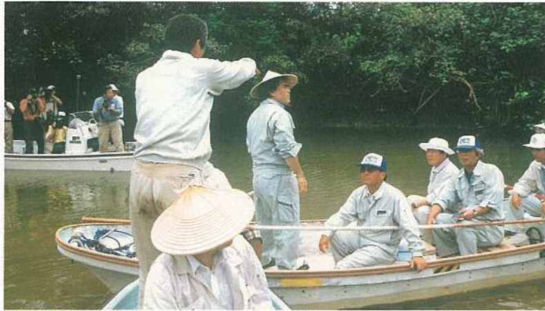
轟橋下方から河口までボートによる現況調査も行なわれました。