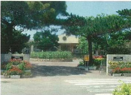
団体の部 市立宮良小学校

平成三年度より国道沿いの花いっぱい運動を実施、活動を通して集落内の環境美化運動にも取り組んでいる。現在では、青年会や公民館とも連携をとりながら地域活動を展開している。